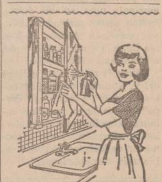
Savo namine valsty spintele reikia nepaprastai švariai ir tvarkingai užlaikyti, kaip šiame vaizdelyje parodyta: išimti visas banketus ir išmazgoti lentynas, patikrinti visus užrašus, kad neįvyktų klaidų, nes valsty su-maitymas gali būti fatališkas, patikrinti, kokiu būdu trūksta ir juos papildyti kad būtų bet kokiam neti-rumui pasitruos.

"NAUJIENOS" SKAITO VISŲ SROVIŲ ŽMONES: DARBININKAI, BIZNIERIAI, PROFESIONALAI, DVASININKAI, VALSTYBININKAI, MOKSLININKAI, JIE ŽINO, KAD "NAUJIENOS" PADUODA TEISINGIAUSIAS ŽINIAS IR GERIAUSIUS RASTUS.