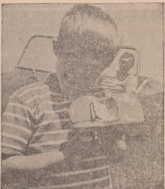
LIKE DADDY, Junior is spending more time with leisure time vehicles. As an example, Tonka's Fun Buggy is displacing traditional pick-ups and dump trucks as this year's best seller.

Pagaliau, kaip pavasaris po sunkios žiemos, prašvito Lietu-vai Vasario 16-toji. Taip daug išskentėjusios Lietuvos sūnūs, išgirdo iš nelaisvės rėtežių be-siveržiančios tautos šauksmą: "Lietuva pavojuje! Kas myli Lietuvą, kas trokšta laisvės, kas pajėgia valdyti ginklą, ne-laukdami nė valandos, eikime laisvės ir Tėvyne ginti! Kaip mūsų tėvai ir sentėviai, drąsiai be baimės, pirmi užstokime priešams kelią! Pakelkim žygi už mūsų motiną Tėvyne, už Lietuvą!" Kas tik galėjo pakel-