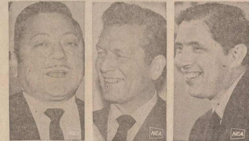
Mario Procaccino John Lindsay John Marchi Šių metų lapkričio 4 d. rinkimuose svarbiausios varžybos įvyks New Yorke, kur dėl mero vietos varžosi trys kandidatai: Mario Procaccino, John Lindsay ir John Marchi.

bar jis savo rajone tegavo 3,063 balsus, kai jaunas konkurentas surinko 15,200 balsus.