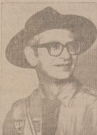
s. v. v. sl.