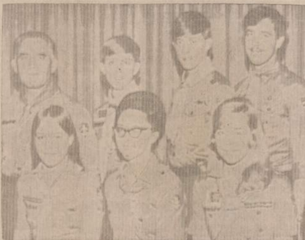
LIETUVIŠKAS IR SKAUTIŠKAS SIETYNAS

Miela būtų įdėti į spaudą ir daugiau tokių šeimų nuotraukų, bet jų, deja, foto korespondentai nepagauna.