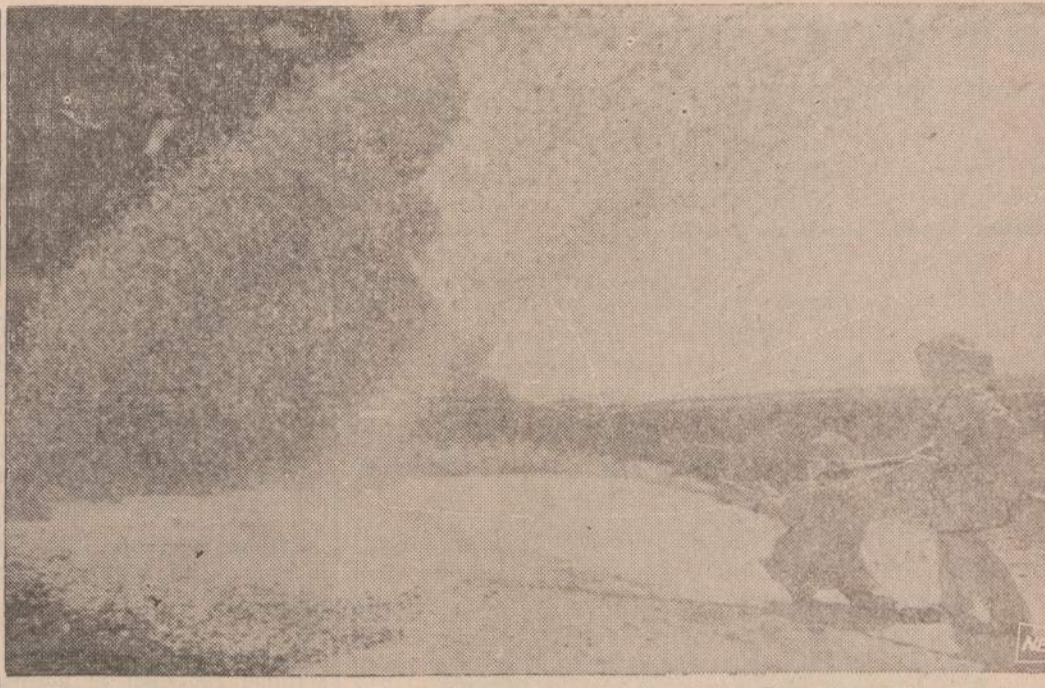
Hamiltono karo aviacijos bazėje yra speciali lėktuvų gairių gesintojų mokykla. Šie ugniagesiai išmoka užgesinti suduziusius lėktuvus ir išgelbėti jų pilotus ar keleivius. Gesinimui vartojamos specialios cheminės putos.

Švietimo Taryba irgi galėjo rasti būdų, kaip vadovėlio nepriimti, tačiau jo "nesurado", bent ligi dabar.