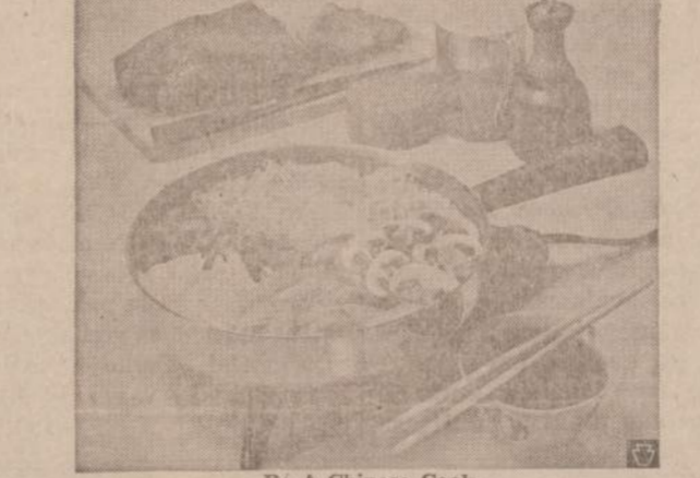
Bė A Chinese Cook

Panaikinus baudžiavą, Skirsnemunio dvaro dvarininkai norėjo, kad žmonės dar eity baudžiavą ir atitinkamą raštą pasirašytų. Žmonėms griežtai atsakius, ponas atkvietė kazokus ir suaukė žmones į kapines. Atvežė du vežimu rykščių, kelis vyrus nuplakė. Gąsdino plakisiai iki mirties visus, kurie neis baudžiavai.