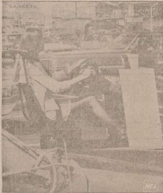
Amerikos vidurinėse mokyklose galima išmesti vairuoti automobilį. Šitokie dirbtiniai vairavimo prietaisai yra jau 600-se mokyklų. Mokiniai stebi eriane nufilmuota gatvės judėjimą ir į jį tinkamai reaguoja. Kai kur tie prietaisai pastatyti prie gatvių, kad studentai jaustų susisiekimo atmosferą ir girdėtų gatvės triukšmą.