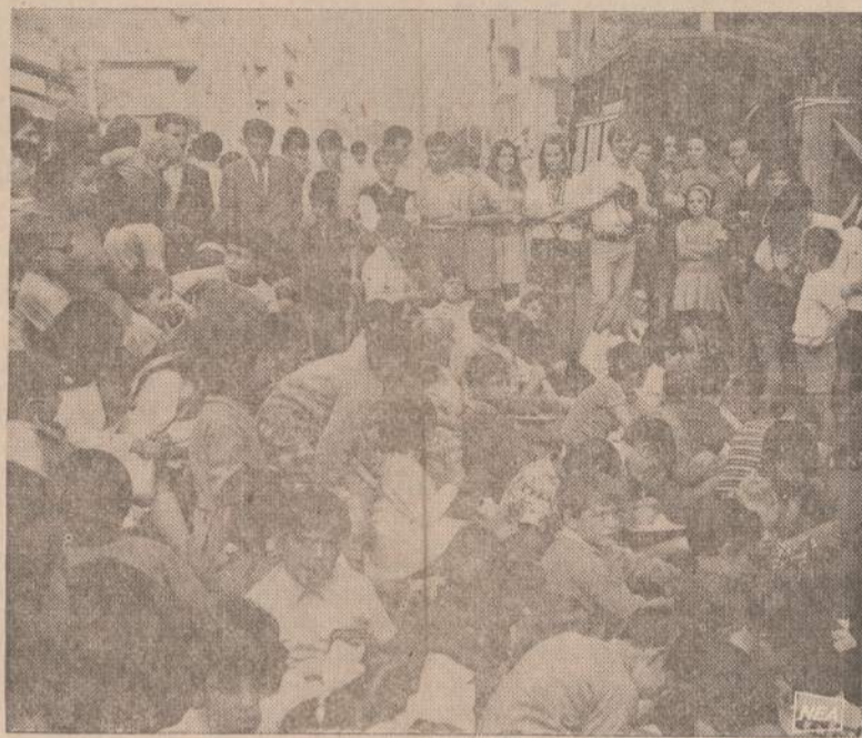
Italijos mokytojai, protestuodami prieš valdžios įvietimo politiką, pravedė pamokas, išsivedė vaikus į gatves. Mokytojai tvirtina, kad Italijai trūksta 150,000 klasių.

Spėjama, kad iki lapkričio 17 d. visi klausimai bus išspręsti. Tą dieną Washingtonan atvyks Japonijos premjeras Sato. Ta proga bus padaryti visi reikalingi sprendimai.