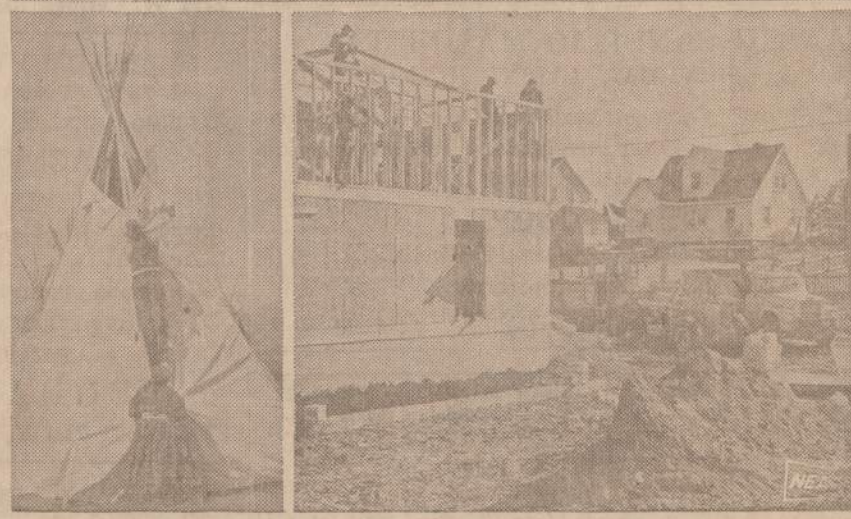
Amerikoje yra nemažai indėnų rezervatų, kur šie seniausieji Amerikos gyventojai labai vargsta. To negalima pasakyti apie 6,000 mohavkų indėnų, gyvenančių 29,000 akru rezervate ant Amerikos - Kanados sienos. Indėnai gražiai tvarkosi, jų 15% dirba vietiniame rezervate pramonėje, o 75% ieško uždrobų kitur. Viršuje — senas indėnų kaimas, apačioje, dešinėje, — naujai statomi namai.