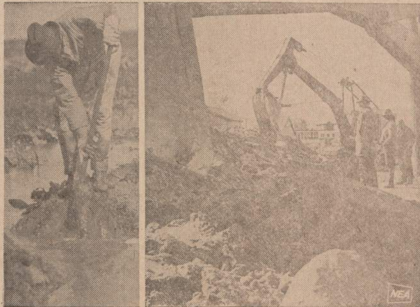
St. Regis indėnų kaime kairėje nuotraukoje parodomas griovį kasą darbininkas prieš 50 metų. Dabar, kaip matosi dešinėje, indėnai statybai vartoja modernias mašinas.

Taurusis Lietuvos Sūnau, išsėkis ramiai šioje svetimoje žemėje, kuri Tave priglaudė. Tu visuomet troškai būti palaidotas tėvynės šventoje žemelėje, kurią tu taip mylėjai, dėl jos kovojai kardu, plunksna,