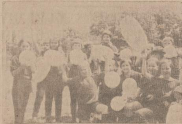
SU BALIONAIS — "KERNAVĖS" PAUKŠTYTĖS — KVADRATO LAIMETOJOS

Jos šiemetinėje Merkinės vardo stovykloje nugalėjo Lietuvos vilkiukų komandą.