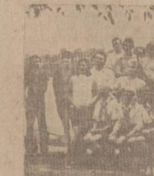
CLEVELANDO AKADEMIKAI SKAUTAI IR SKAUTĖS, stovyklavę rugsėjo savaitgalį prie Pymatuning ežero.