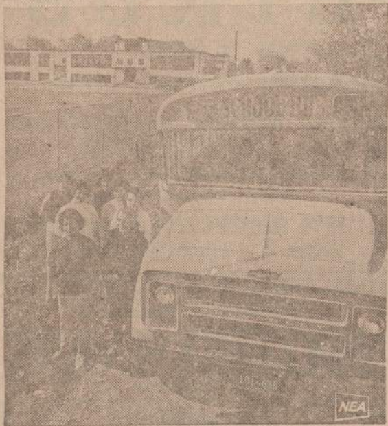
Virtutinėje fotografijoje matoma, kaip indėnė motina gabendavo mokyklą savo vaikai prieš 50 metų. Dabar indėnų vaikai važiai mokyklą naujais autobusais. Daug Kanados ir Amerikos pasienyje gyvenančių St. Regis kaimo indėnų baigia universitetus ir įsigyja specialybes.