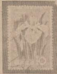
JAPONIJOS PAŠTO ŽENKLAS vaizduoja irisus (1961 m.)

Viena iš pirmųjų žydninčias gėles atskirai savo pašto ženkuose ėmė vaizduoti Sveicarija, paeilini per kelerius metus išleisdama net kelias serijas su jos krašto augalais ir žiedais. Pvz., 1943 metais išleistoje serijoje parodytas sidabrinis da-gys, kumtapluokas ir mėlyna kalnų gėlė — Gentian.