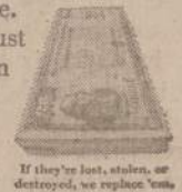
If they're lost, stolen, or destroyed, we replace 'em.

And that's just what we need in this country right now.