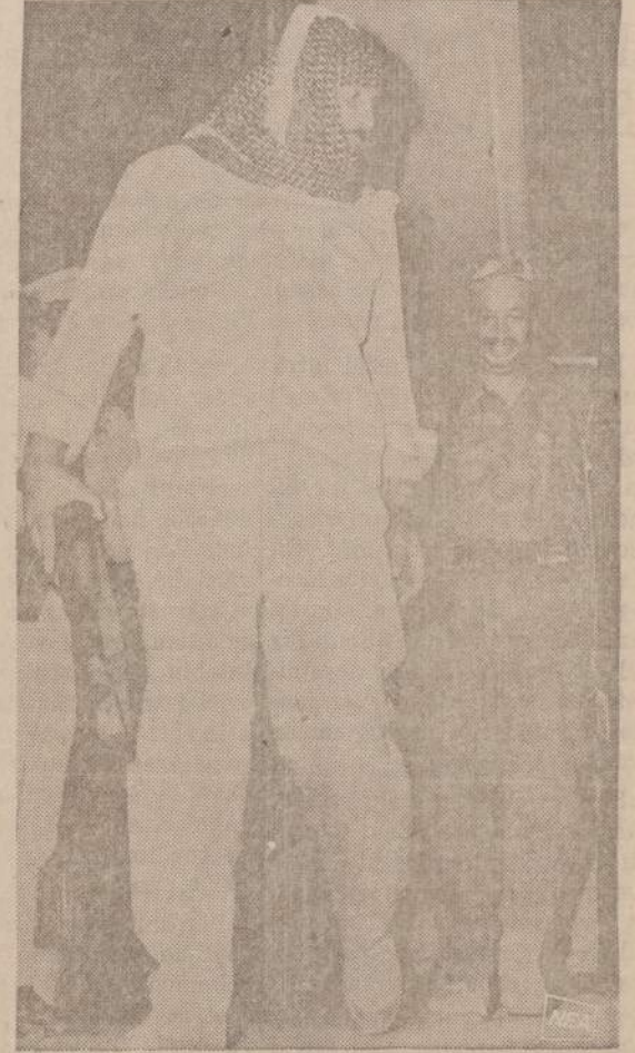
Došinėje Palestinos arabu partizanų Al Fatah organizacijos vadas Yasser Arafat. Jis labai saugomas ginkluotų sargybinių. Bijoma, kad Izraelio agentai jo nenužudytų.

Podagros gydymas šiandien skaitomas tiek sėkmingu, kad reumatologų tvirtinimu praktiškai visu 100 nuosimčių ši liga gali būti pašalinama.