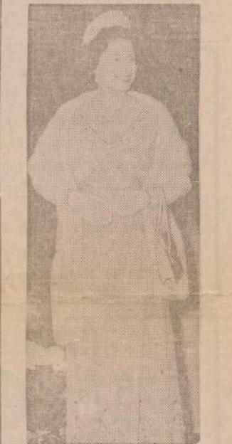
Britanijos karalienė Elžbieta iš vyriausybės gaus per savaitę 21,921 dolerį algos. Ji, be to, dar turi per metus apie 400 tūkstančių dolerių pajamų iš savo žemių. Britų vyriausybė svarsto ar nereikėtų pakelti karalienės algos, nes girdisi skundai, kad gaunamų pinigų karališkai šeimai ne-užtenka.