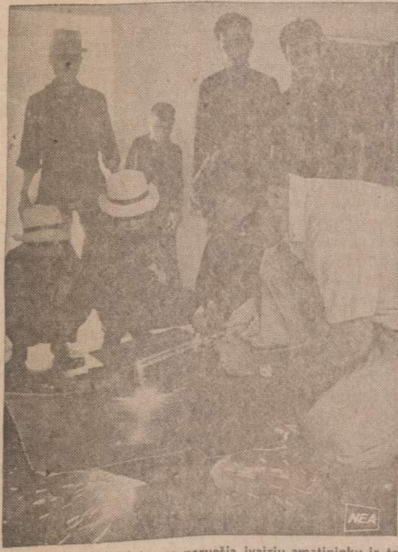
Amerikos specialistai Vietname paruošia įvairių amatininkų ir technikų iš buvusių kareivių ir karo pabėgėlių. Paveiksle matoma grupė mokoma dirbti metalo virinimo darbus.

Atlikę kruviną darbą partizanai pasišalino, kareivius palikdami savo likimui. Tai tokia tragedija įvyko Sibire prieš 50 metų.