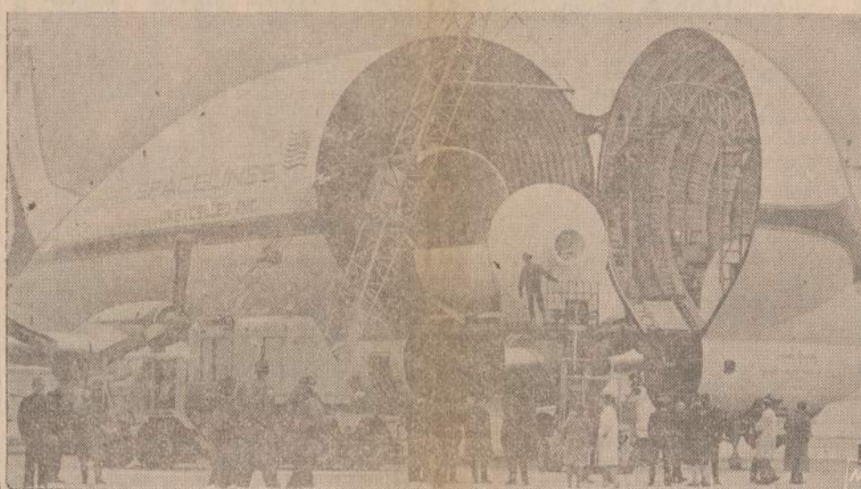
"Super Guppy" transporto lėktuvas buvo specialiai pagamintas vežioti erdvėlaiviu dalimis iš įvairių imonių į Cape Kennedy tyrimų centrą. Lėktuvas atsidaro liečianis viduryje, kur jo aukštis siekia 25 pėdų.

Nėra ko tikėtis, kad jie tuos šakalius imtų sau iš akių krapštyti, bet vistiek — tegu nesijaučia, kad niekas jų nemato.