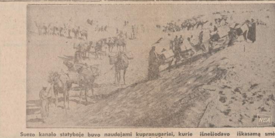
Suezo kanalo statyboje buvo naudojami kupranugariai, kurie išnešiodavo iškasamą smėlį toliau į dykumą.