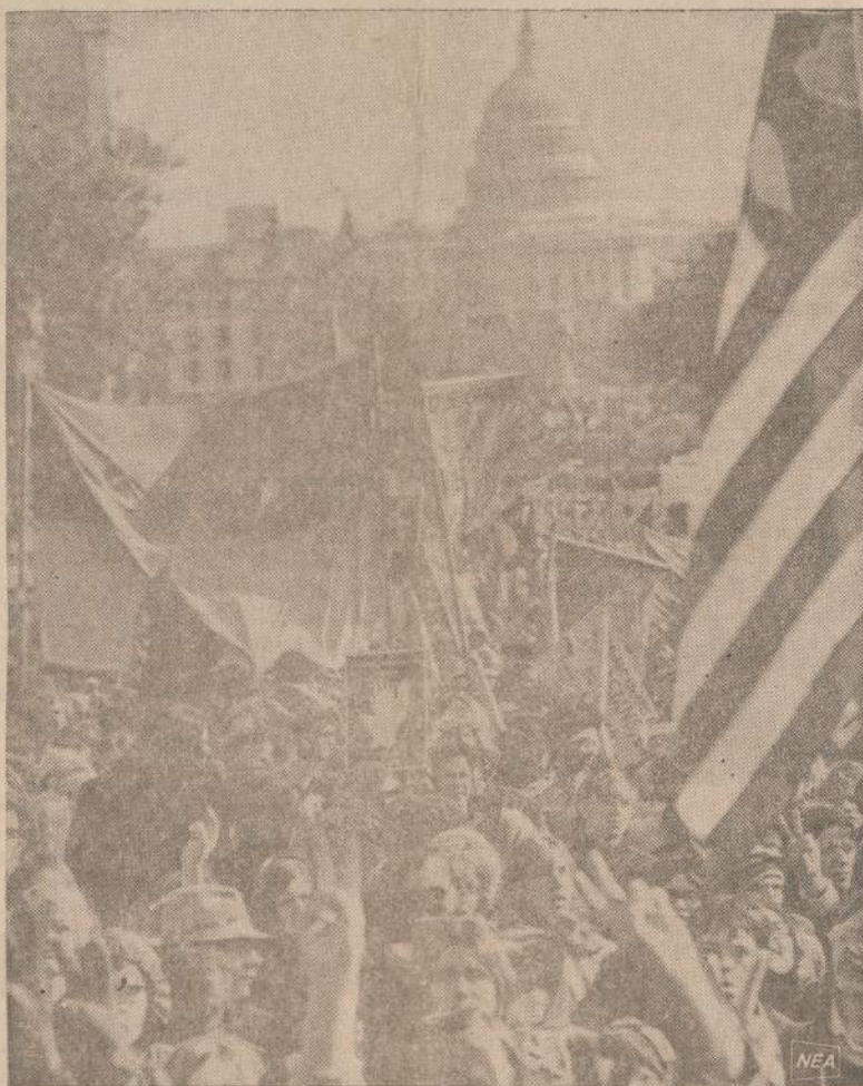
Prėjusios savaitės demonstracijose prieš Vietnamo karą dalyvavo įvairių pažiūrų amerikiečiai. Vis dėlto, dominavo prokomunistinės nuotaikų, kaip matoma iš šios fotografijos, kur matoma Viet Congo vėliava, o dešinėje — sudarkyta JAV vėliava su širdelėmis vietoj žvaigždžių.