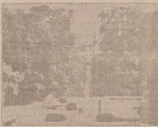
Įsruties miesto parkas su laiptais, vandeniais ir naujais turgaus aikštelėmis. Parko pakraščiu teka upelukas, ant kurio ordino laikais būta dviejų malūnų tvėnkinių. Vienas iš šių tvėnkinių vadinosi Gavėnų prūdu.

Taip bekliaudami mes pasiekiamė Auksinės upės slėnį. Jos slėnis yra giliai įsigrauzęs į sunkių molių dirvožemių gamtovaizdį. Prie Matininkų kaimo, mes perkertame Įsruties - Kuršių geležinkelio liniją ir netrukus pasiekiamė Vitgirius (Witgiren) prie didelio Vitgirių miško, greičiausiai išsivysčiusio iš ankstyvesnio Vidugirio pavadinimo, nes ir lietuviškus pavadinimus bevykietiant Vitgirių vardas buvo pakeistas į Mittenwalde, tikslų lietuviško Vidugirių vėrimą į vokiečių