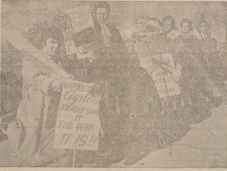
Meratoriumo ir demonstracijų priešai Washingone turėjo savo pasirodymą. Būvo pasirašyta peticija, pritaranti Vyriausybės politikai Vietnamo.

Tipinga lietuviškai Amerikai: jo buvimu tepasinaudojo Čikaga, Detroitas ir Bostonas.