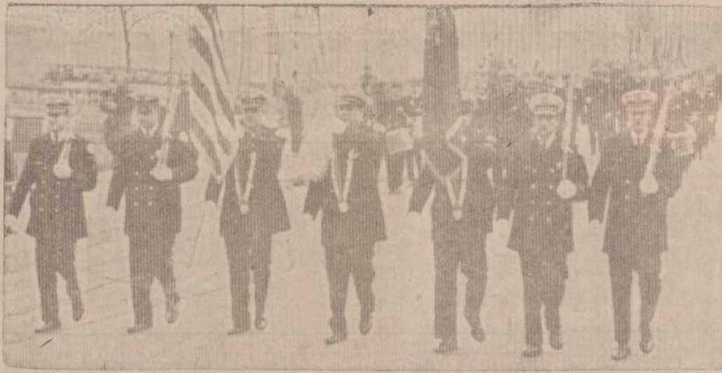
Veteranų Dieną paradoje dalyvavo Chicago policijos dalinys. Paveikslė matome policininkus, nešančius vėliavas ir žyguojančius paradoje. Policija prašo gyventojus padėti jai palaikyti tvarką mieste.

„Užuot atsegiojęs mūsų nešulius, jis prapliaustė visus peiliu ir išvertė mūsų visus drabužius ir dovanas ant grindų, visą laiką juokdamasis ir juokaudamas. Mano vyras buvo išvilktas ir apieskotas. Colettė, labai kentėjusi nuo anginos, verkė. Jai turėjome pasiėmę vaisių, nes vagonė nebuvo nei maisto, nei vandens, o kai jie tuos užmatė, tai nusiuntė pakviesti sudėtingą uniformą apsiėmusios moters — maisto inspektorės, kuri visus vaisių perpiovė per pusę.“