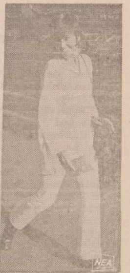
Filmu aktorė Jane Fonda, atsilankiusi Indijoje, pasipuolė tradicinėmis indy pižamom.

tai visų pirma tuo, kad jis buvo perdaug padorus, taurus žmogus. Pals būdamas atviras ir tiesus — jis nesuprato klastos ir pasaly; būdamas garbės ir teisės vyras — jis nesuprato intrigu ir priesaiklausių; būdamas didžiai jautrus kiekvienam pavojui Lietuvai — jis netikėjo, kad rimti valstybės vyrai dėsį į konspiracinę avantiūrą, kuri juk taip greitai galėjo virsti brožūdišku vidaus karu ir tuo pat Lietuvos valstybės pražūtį!