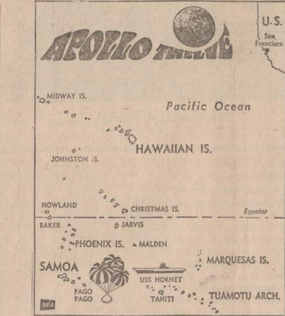
Apollo 12 nusileis į Ramųjį Vandenyną, pietryčiuose nuo Samoa salos, apie 4,500 mylių nuo San Francisco miesto. Astronautų ten laukia karo laivas "Hornet".

WASHINGTONAS. — Viceprezidentas Agnew Kalėdas praleis keliaudamas po Azijos kraštus. Jis aplankys Australiją, Naująją Zelandiją, Taiwaną ir Filipinus. Galimas daiktas per pačias Kalėdas jis aplankys JAV kareivius Pietų Vietname.