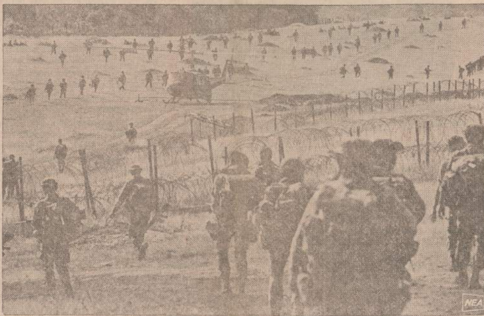
Specialių Jėgų stovykla Bu Prang kareiviai išsina į priešpuolį, šiaurės Vietnamo daliniai stovyklą laikė apsupę tris savaites, kol atėjo daugiau jėgų ir kol didieji bombonešiai nenutildė komunistų artilerijos aplinkines diunglases.

Nors šis berniukas tik 14 metų, jis jau patyręs karys. Anksčiau kovojęs Viet Congo pusėje, jis perėjo į Saigono vyriausybės kariuomenę, kur pasižymėjo, kaip geras šautuvis.