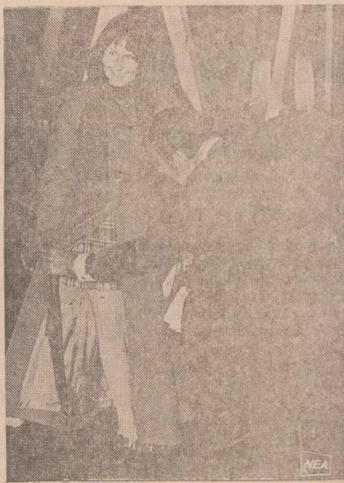
Filmų aktorius David Niven norėjo patirti, kas yra po reporterės, kuri jį pasitiko Londono aerodrome, nauju "maxi" apsiaustu. Pasirodė, kad jį nešioja "mini" sijonėlį.