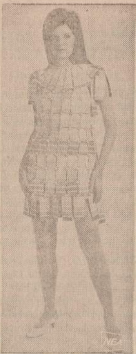
Modelio suknelė pagaminta iš įvairių spalvų popieriaus lakštelių. Joje yra 720 įvairių atspalvių.

Prieš penkerius metus jis apsigyveno savo apartamentelyje 14 aukšte, kur pro langą arčiau apačioje kaip ant delno mato Sedgwick rajono lūšny primėžtus kiemus, purvais apskretusius langus ir