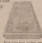
If they're lost, stolen, or destroyed, we replace 'em.

Millions of them show their pride by buying U. S. Savings Bonds. Through regular purchases where they work or bank, they've helped preserve our freedoms by investing in their country. At the same time, they've been storing up quite a nest egg for themselves. U. S. Savings Bonds pay a guaranteed return. And your investment is backed by the full faith and credit of the United States of America. Also, the interest on Series E Savings Bonds isn't subject to state or local income taxes. You can defer federal taxes on E Bond interest until you redeem the Bond. If your Bonds are lost, or stolen, or destroyed, we simply replace them without cost. They're safe. They're easy. They're automatic. And they're also a reminder. A reminder that we all have to work hard to keep what we have. Investing in your country will do just that. Think about U. S. Savings Bonds. It's a way to keep our country from getting folded, spindled or mutilated.