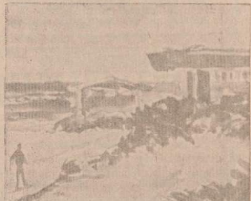
M. SILEIKIS Illinoiso valstybinis parkas