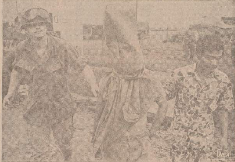
Amerikietis karys ir vietnamietis vertėjas veda sugautą Viet Congo kareivį į apklausinėjimo vietą. Belaisviui ant galvos uždėtas maišas, kad jis nematytų, kur eina, nesužinotų vietovės išdėstymo.

Baltieji Rūmai šia rezoliucija esą labai patenkinti.