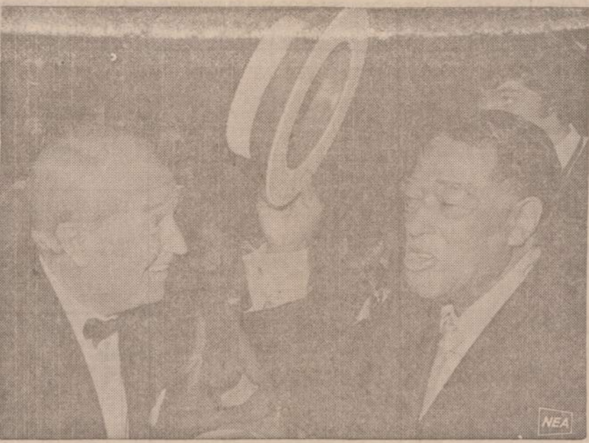
Du seni muzikos pasaulio veteranai: kairėje prancūzas Maurice Chevalier, 81 metų amžiaus, dešinėje: amerikietis, džiazo muzikos kūrėjas Duke Ellington, 70 metų.

no, kaip šie namai, Detroito neturime. Kol atsiras atsargiai planuojamas kultūrinis centras, dar reikės gerokai palaukti.