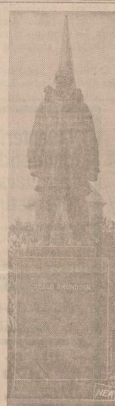
Atrodo, kad norvegų keliautojo ir tyrinėtojo Amundseno statulą kaž kas papuošė "kvalio kopure". Iš tikrųjų fotografas patiekė kartu nuotrafa fuoti bažnyčios bokšto smaigali.

REMKITE TUOS BIZNERTUS, KURIE GARSINASI NAUJIESE