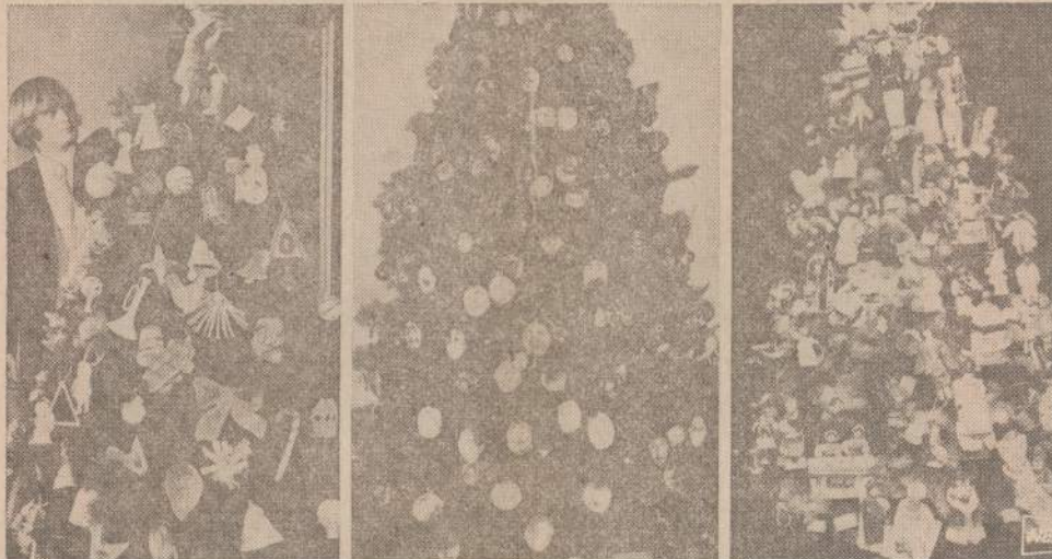
Atsilikusių protiniai vaiku globos draugija pakvietė žymius amerikiečius užsakyti specialias Kalėdų eglutes. Kairėje aktorius David McCallum eglutė papuošta iš popiejaus, siūly, makaronų ir metalo plokštelių pagamintais papuošalais. Viduryje kardinolo Terence Cooke eglė, su visų rasių ir visų tautybių vaikų atvaizdais. Dešinėje — pirmos negrės Atstovų Rūmuose Shirley Chisholm eglutė, papuošta visų tautų lėlėmis.