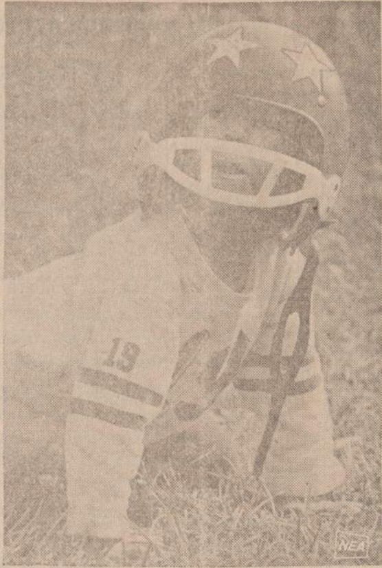
Kingsport, Tenn., berniuku klube yra futbolo komanda, kurios visi nariai yra 6-8 metų amžiaus. Čia matomas vienas stipriausių tos komandos žaidėjų.