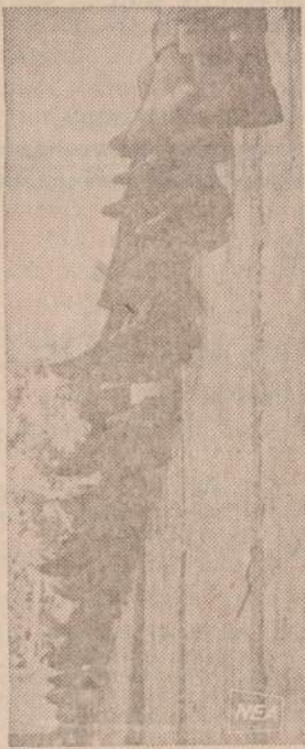
Lebano, Beirute futbolo rungtynes stebi ant aukštos tvoros susėdę jaunuoliai. Fotografas šį retą vaizdą pagavęs, rašo, kad "vienas žiūrovas pasiėmė batus". Jam neatleista galvon mintis, kad jis batų gal neturi.

Apklausinėjamai parodė, kad visais atvejais, išskiriant apsigyvenimą, daugiau kaip pusė apklaustųjų pasisakė, kad dabar gyvena geriau. Kad blogiau gyvena pasisakė tik apie 10 nuosimėjų.