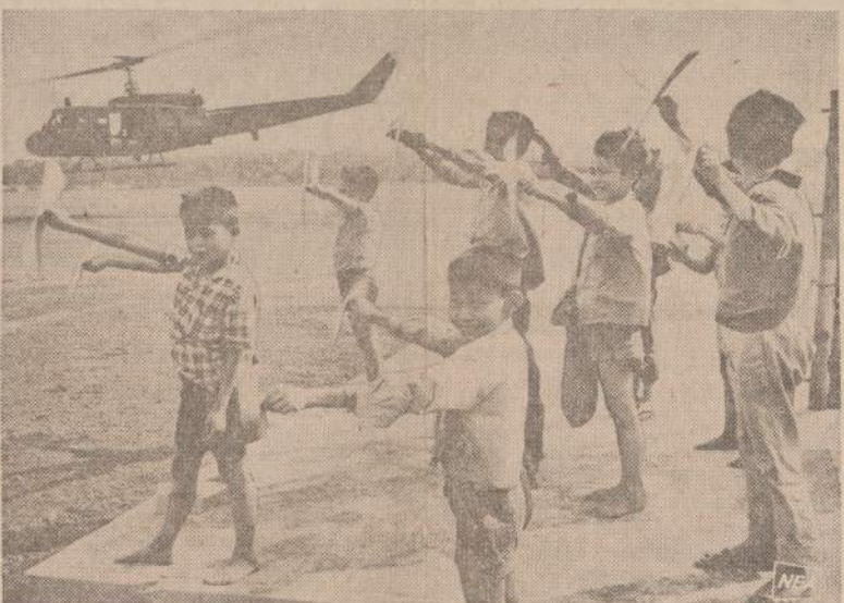
Vietnomo vaikai mėgsta susirinkti prie karinių aerodromų, stebėti lėktuvų. Ši grupė išnaudoja helikopterio sukeltą stiprų vėją savo žaismams — įvairių "modelių" propeleriams sukti.

Senatorius pareiškė, kad karo naštos perdavimas patiems vietnamečiams tik prailgina Vietnamo žmonių kančias ir karas taps "nuolatinis". Amerika sugrįš prie anksčiau turėtų "paterėjų" vaidmens, o Vietname be galo tęsis teroras ir mirtis. Sen. Fulbrightas kalbėjo apie Amerikos galią ir aroganciją. Amerika esanti lyg prisidėjusi narkotikų, nes neribota galybė esanti kaip narkotikas. Senatorius pagaliau įrodinėjo, kad Amerika neturi gyvybinių interesų Pietų Vietname. Amerikai turi visai nebūti svarbi, ar Vietnamą valdys komunistai, nekomunistai, ar jų abiejų koalicija. Amerikai nesvarbu ar šiaurės ir Pietų Vietnamas bus sujungti ar ne. Fulbrighto nuomone, Amerikai turėtų rūpėti išlaikyti vietnamečių nacionalizmą, nežūrint kokioje formoje. Dabar strateginiai interesai užleido vietą ideologiniams interesams ar net ideologiniam pasiutimui, dėl kurių esą neverta kariuoti.