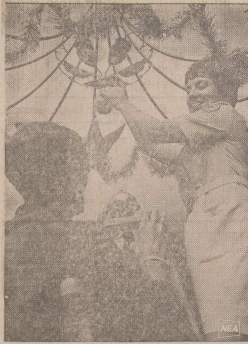
Sužeistas amerikietis karys padeda Raudonojo Kryžiaus slaugėi įsikabinti kalėdinius papuošalus.

Faktai rodo, kad Aleksandro Stulginskio būta sumanaus politikos. Jis buvo didelis valstybininkas bei demokratybės gynėjas ir tolerantiškas vienybės šalininkas. Antai, prie jo Ernestas Galvanauskas ketvertą kartų, o Dr. Kazys Grinius kar-