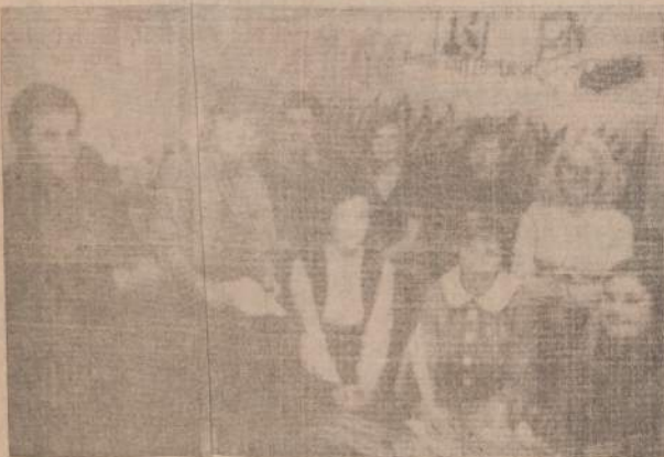
BURELIS OSTONO AKADEMIKŲ SKAUTŲ-Ū bendroje veigijoje naujosiems planams aptarti.

Išrinkta Vyr. Skautininke 1952 Clevelande ji įvykdė vieną iš svarbiausių uždavinių.