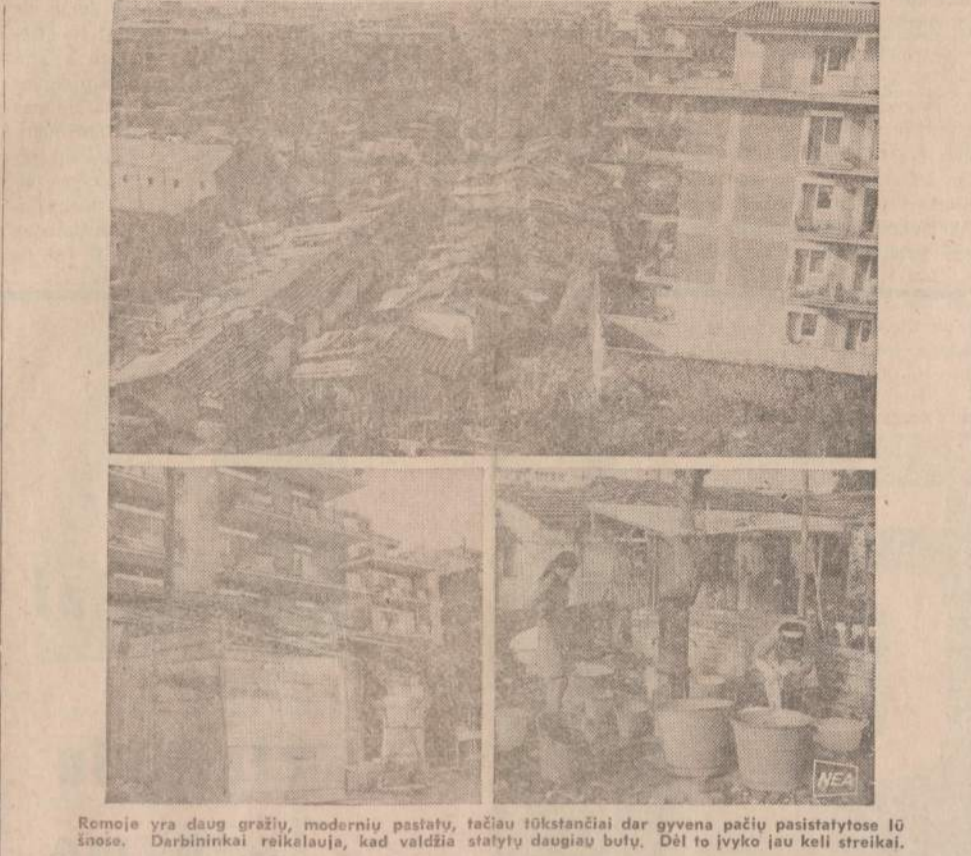
Romoje yra daug gražių, modernių pastatų, tačiau tūkstančiai dar gyvena pačių pasistatytose lūšnose. Darbininkai reikalauja, kad valdžia statytų daugiau butų. Dėl to įvyko jau keli streikai.

Lenkija ir Rytų Vokietija pas-kelbia sutinkančios derėtis su Vakarų Vokietija. Valstybės se-kretorius Rogers pasako kalbą apie arabų-žydų konfliktą. Kal-ba sulaukia daug protestų žydu tarpe. Izraelio jūreiviai slapta iš-plaukia su penkiais karo lai-vais, kuriuos Prancūzija atsisa-kė parduoti Izraeliui. Vicepre-zidentas Agnew pradeda savo kelionę po Azijos kraštus.