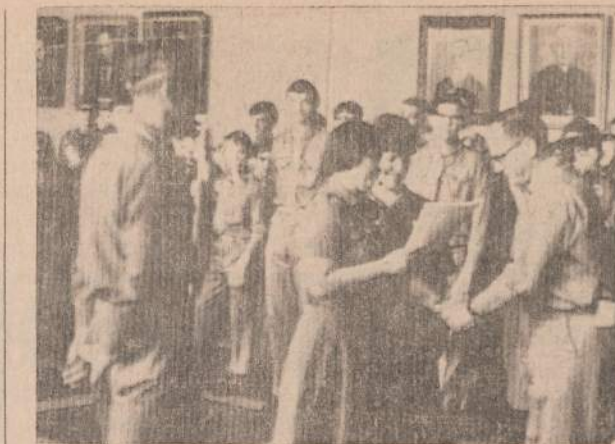
ATSISVEIKINA SENIEJI CHICAGO TUNTININKAI