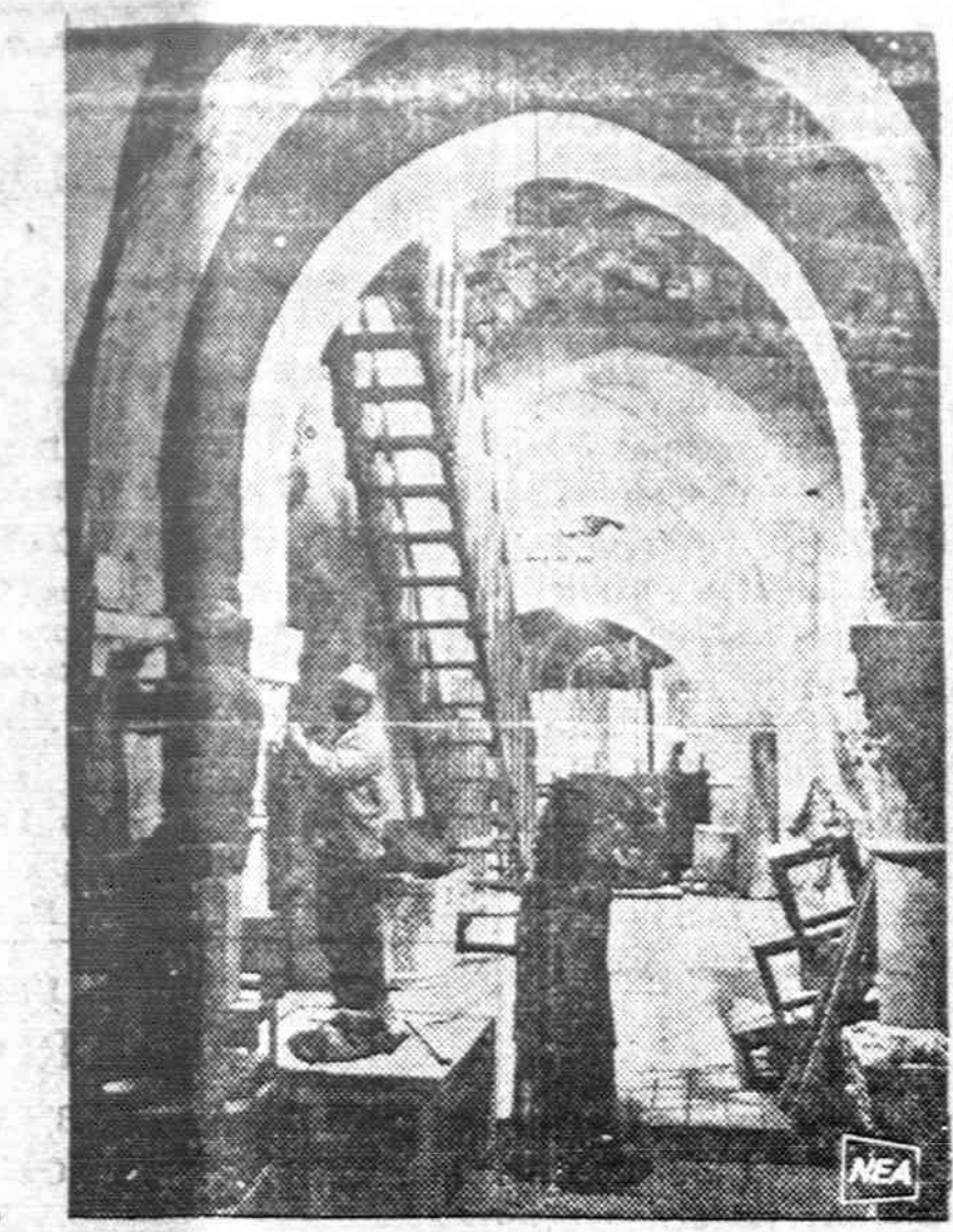
Priziūrint graikų sentikių vienuolii, skulptoriai iškalta naujus bizantiskus motyvus šv. Kapo bažnyčioje, Jeruzalėje, kurioje pradėti dideli remonto darbai.

Valdybų rinkimuose mažai kas pasikeitė. Pasikeitė tik Chicago Lietuvos Suvalkiečių draugijoje. Amerikos Lietuvių Piliiečių Pašalpos Klube, Joniškėčių Labdarybės ir Kultūros Klube, Ervilko Draugiškame Klube ir kai kur kitur. Daugumoje organizacijų pasiliko tos pačios senos valdybos. Pasak to posakio: "Senas apžėlęs kel-