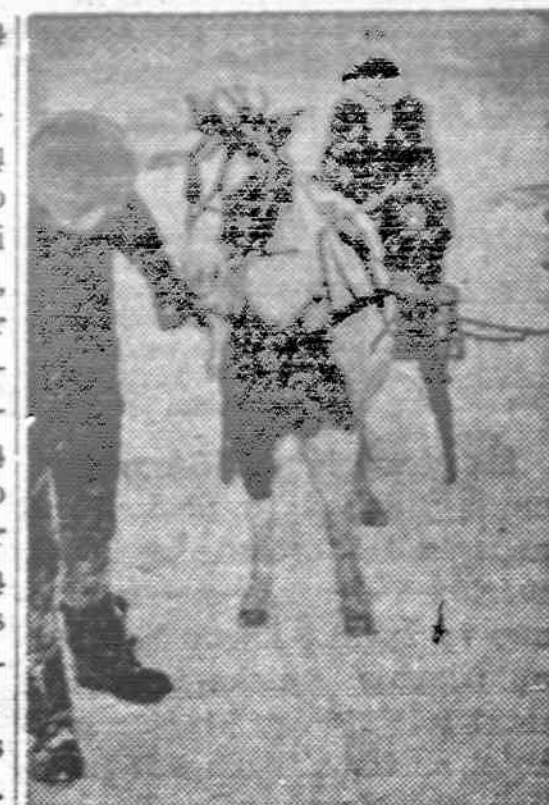
Albany, N. Y. automobilistas bandė senoviniu būdu ištraukti savo automobilį iš sniego pūsnies, tačiau pavelske matomas arklukas neįstengė to padaryti.

X. Esame krikščioniškosios kultūros žmonės, todėl ir reiškimės savo krikščioniškąja kultūra, kaip ja reiškesi Aleksandras Stulginskis.