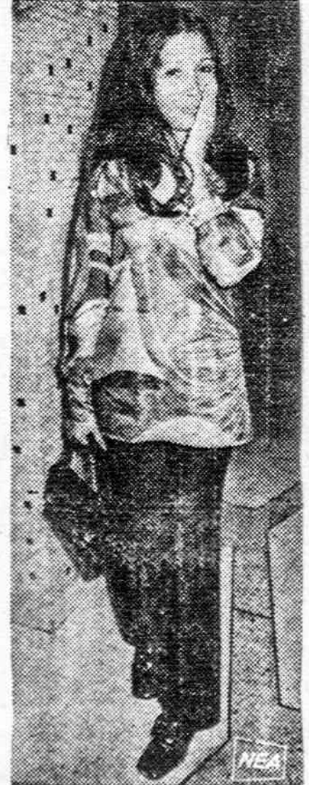
Kambodijos princesė Bopha Deve, princė Norodom Sihanouk dukte, nušėbo žmonių rodomo įai dėmesiu, kai ji lankėsi Indonezijoje.

ROTTERDAMAS. — Olandijoje 22 valandas siautė gaisras dideliame Rotterdame prekių sandėlyje. Nuostolių padaryta keli milijonai dol.