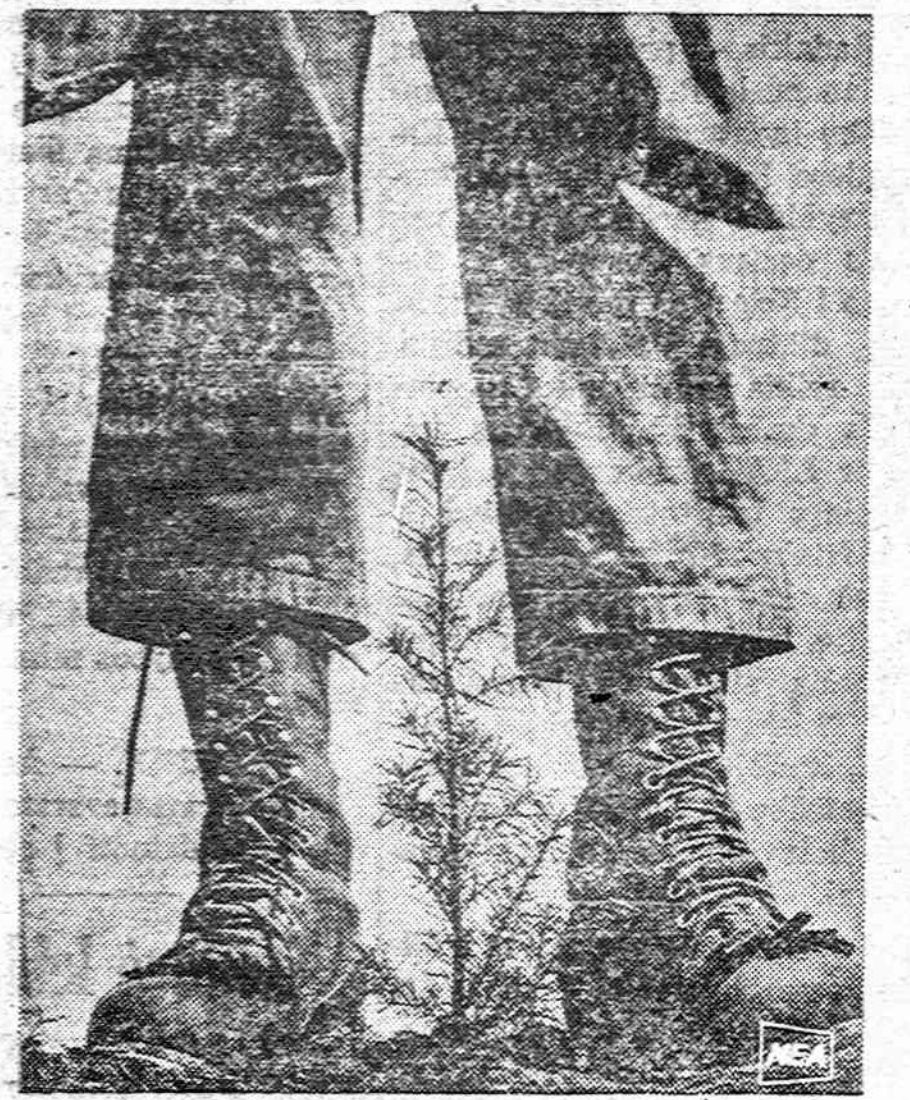
Tai ne mišino kojos, apžergusios didelį medį, o Kanados girininko batai prie tik pasodinto daigo. Kanada iki 1975 metų pasodins 100 milijonų naujų medžių.

Vagišiai turėję savo tarpininką, kurs jų pavogtus daiktus laikydavo ir parduodavo, pats duodamas užsakymus kokius daiktus reikia vogti.