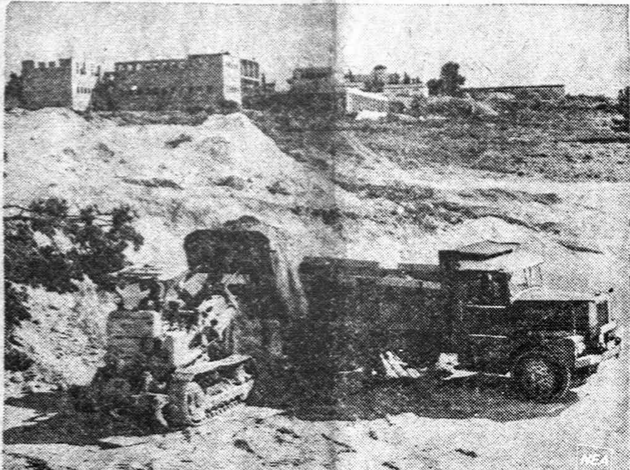
Izraelis nesirengia arabams sugrąžinti Jeruzalės. Tai įrodo ir platus miesto atstatymo darbai. Buvusioje Jordano dalyje statomi studentų bendrabučiai.

Tam piktam, aiškingo būdo žmogui ir buvo pavesta rūstybė kreipti Vatikano ir jo radijo link.