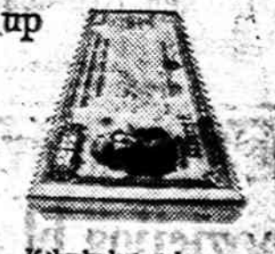
If there's ever a storm, or destruction, we replace 'em.

As for Miss Liberty, well, when you're in New York go up and see her sometime.