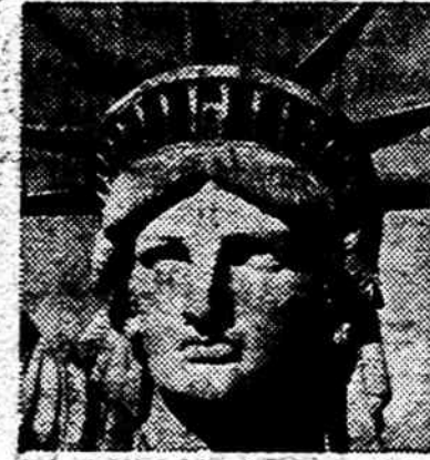
A. Little Orphan Annie. B. The Jolly Green Giant. C. The Statue of Liberty. D. Miss West.

If you picked anything other than C, well, you're in a whole lot of trouble.