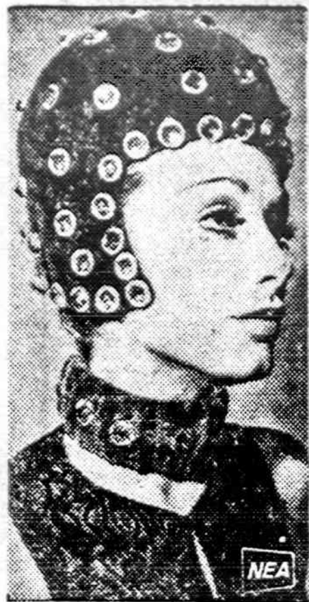
Londono parodyta nauja skrybėlė, suderinta su kaklo papuošalu.