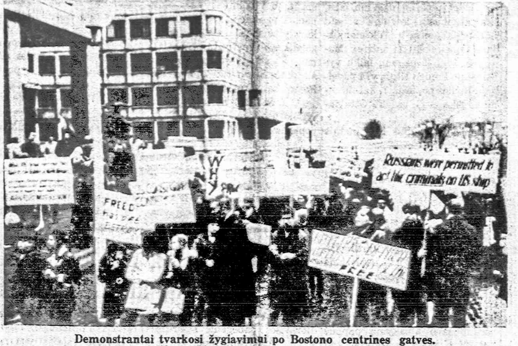
Demonstrantai tvarkosi žygiavimui po Bostono centrinės gatvės.

Britai nusavino aukšą Straipsnis primena, kad pernai, po trijų dešimtmečių ginčų,