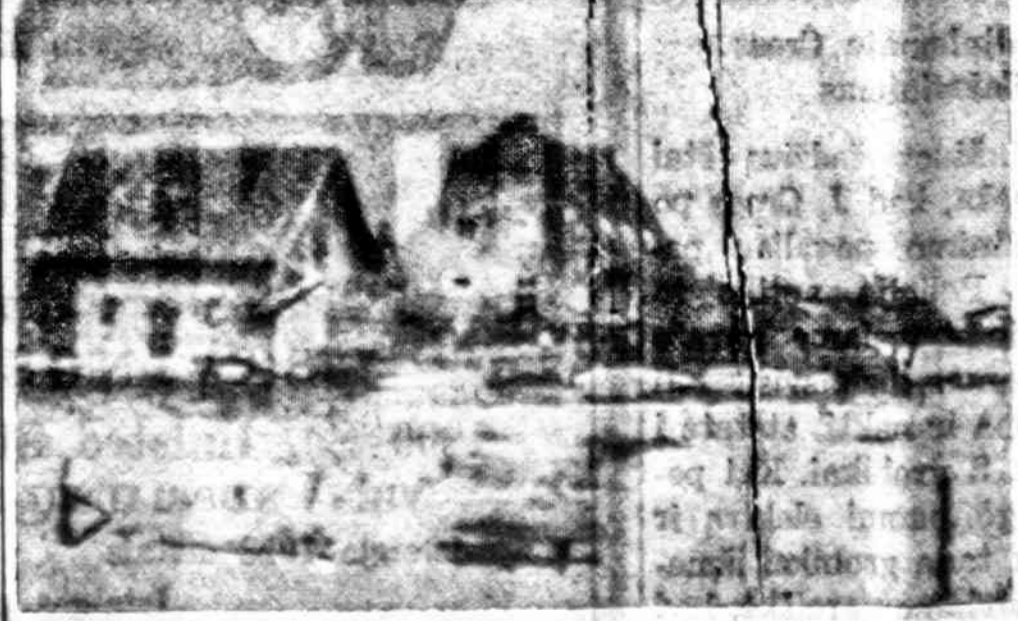
Išvyniusi Gilija prie Senųjų Lapynų. Apsamtas mokyklos kiemas