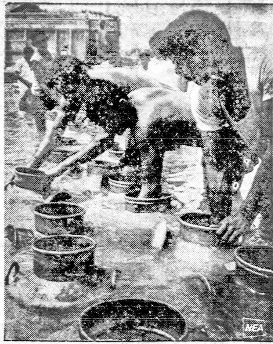
Indijoje nėra modernių pieninių, trūksta šaldytuvų. Ūkininkai, kaip čia nuotraukoje parodoma, užvirina pieną ir supylė į bidonus, sustalo juos šaltos, iš kalnų atnešančios upės vandenį. Jie pienu raminomis maisto, kol jis ataušta, tada veža į miestus parduoti.