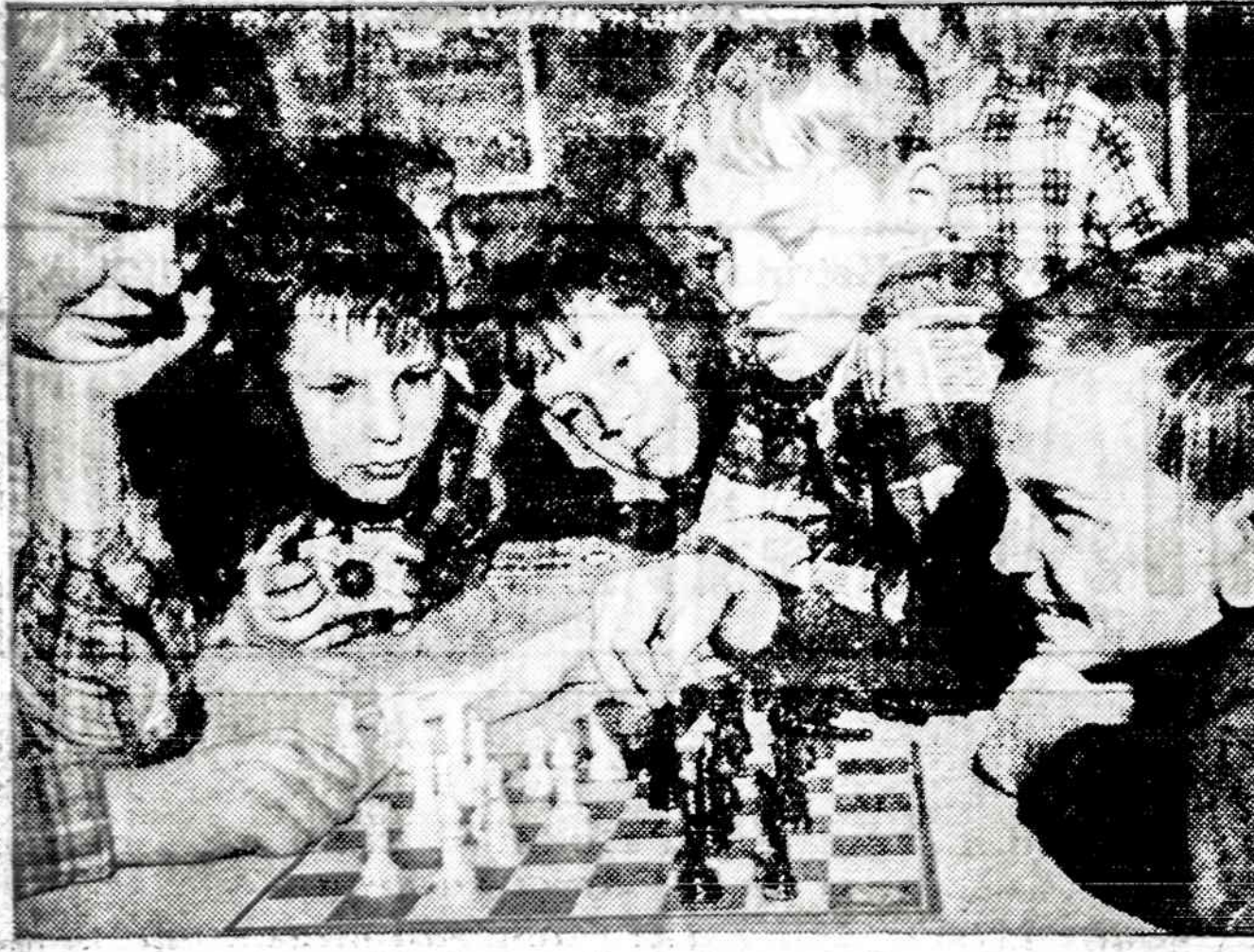
Vaikų fotografų parodoje išstatytas šis paveikslas, pavadintas "The Big Match".

Minėtų suliesėjimui skirtų saldumynų pardavėjai į juos įmaišo vitaminų ir mineralų. Pastarieji priedai visai nereikalingi, jei žmogus maitinasi normaliai. O jei jis nenormaliai minta, jokie tuose saldumynuose priedai neatstos normalaus maisto. Čia, matom, visada pralaimi nesiorientuojąs, galvą pametęs persivalgytojas. Užtai niekada nepamiršim tiesos, kad suliesėjimui skirtas maistas yra tūkstanties kalorijų dieta — tvarkingai nustatyta, kad ne-