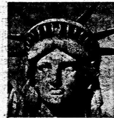
A Little Orphan Annie. B. The Jolly Green Giant. C. The Statue of Liberty. D. Miss West.

If you picked anything other than C, well, you're in a whole lot of trouble.