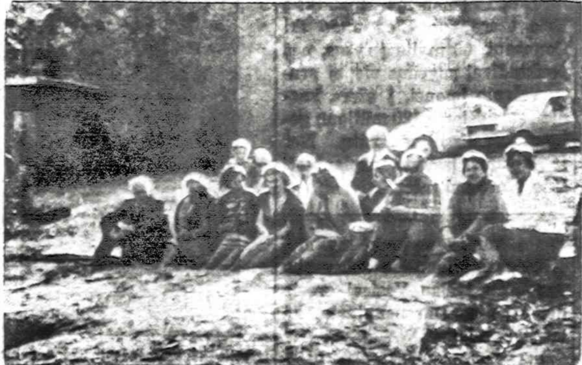
AUSTRALIOJE, SIDNEJUE, SENIEJI SKAUTAI ĮKURĖ SAVO "ŽIDINI"