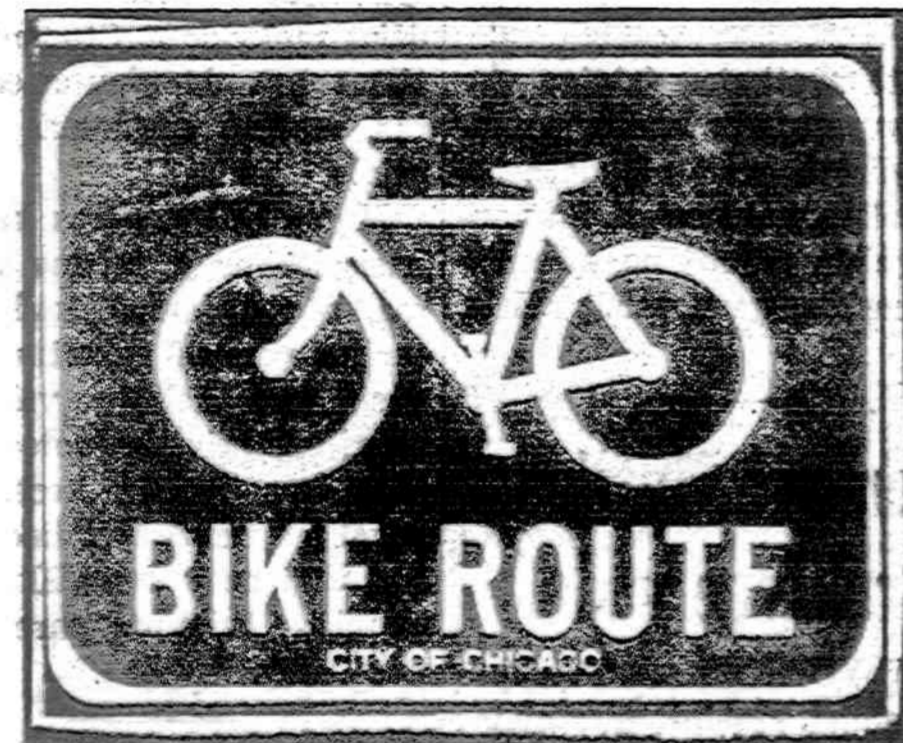
Chicagos mieste kol kas dar tik šiaurinėje dalyje ir Hyde Parke gatvėse matomi trafiko ženklai dviratininkams: baltas dviratis žaliaame lauke.