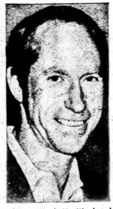
Astronautas Alfred M. Worden kelias mėnuis su Apollo 15. Kelionė prasidės liepos 26 dieną.

Meksikoje ši arklių liga susirgino 779 asmenis ir neoficialiomis žiniomis 30 žmonių jau mirę. Tė patys šaltiniai tvirtina, kad Meksikoje išdėvė 15.000 arklių, nors valdžia praneša tik apie 3.000.