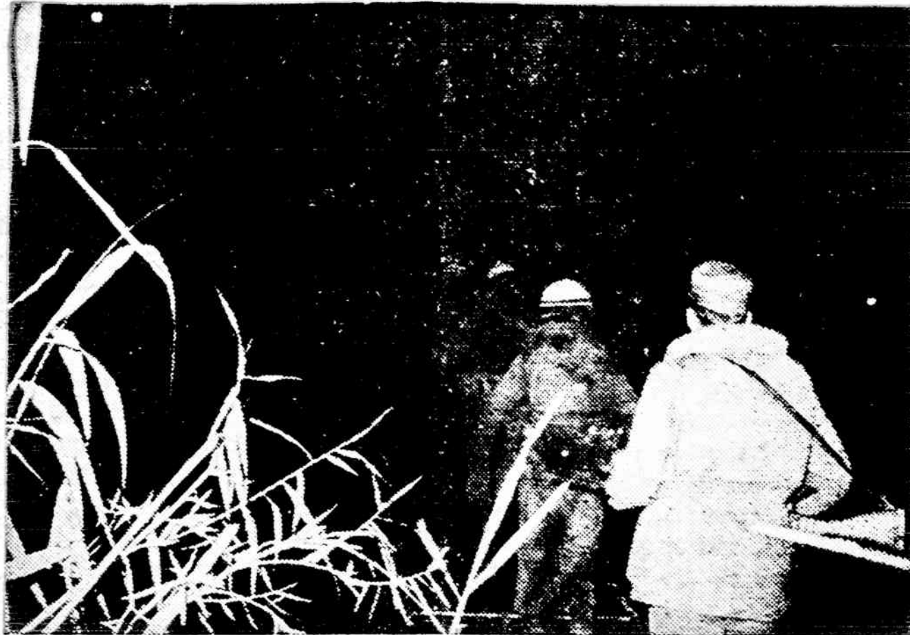
Izraelio kariuomenės patrulis naktį žygiuoja prie Jordano upės, pereidamas surištais plaukais ir kiton pusėn. Karsiviai ieško arabų partizanų, kurie vėl pradėjo dažniau puldinėti Izraelio ūkius ir kaimus.

reikalų ministerija davė Restonui vertėjų, kurie padėjo jam susikalbėti su gydytojais. Žurnalistas ligoninėje teks išbūti apie 10 dienų. Su Restonu Kinijoje važinėja ir jo žmona.