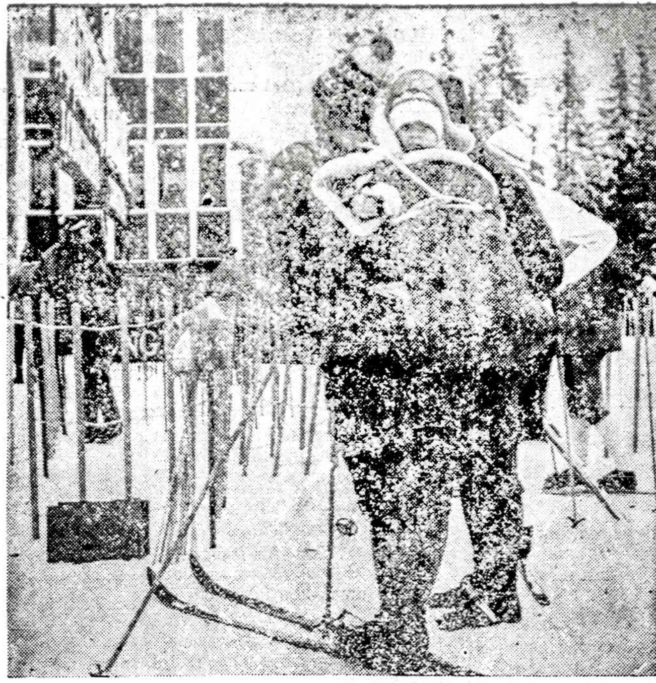
Cekoslovakijos Tatra kalnuose slidinėjimo mėgėjai praleidžia ištisas dienas. Paveiksle matoma visa slidinetojų šeima, kurios mažiausias narys dar per mažas užsidėti slides.

Sios savaitės pradžioje per Ameriką praūžusi sniego, vėjo ir speigų audra prasidėjo Kanados vakaruose.