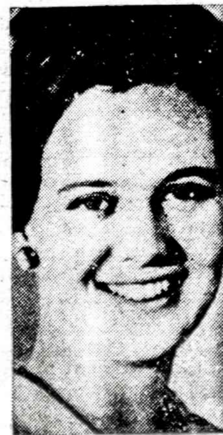
Danijos monarchija yra jau 1,000 metų, tačiau tik antra karta į sostą atėjo moteris — karalienė Margrethe II-jė.

◆ Kolumbijoje nuo kalnų nuslinkusi žemė sugriovė pusę Labateca kaimo, kur žuvo 50 žmonių.