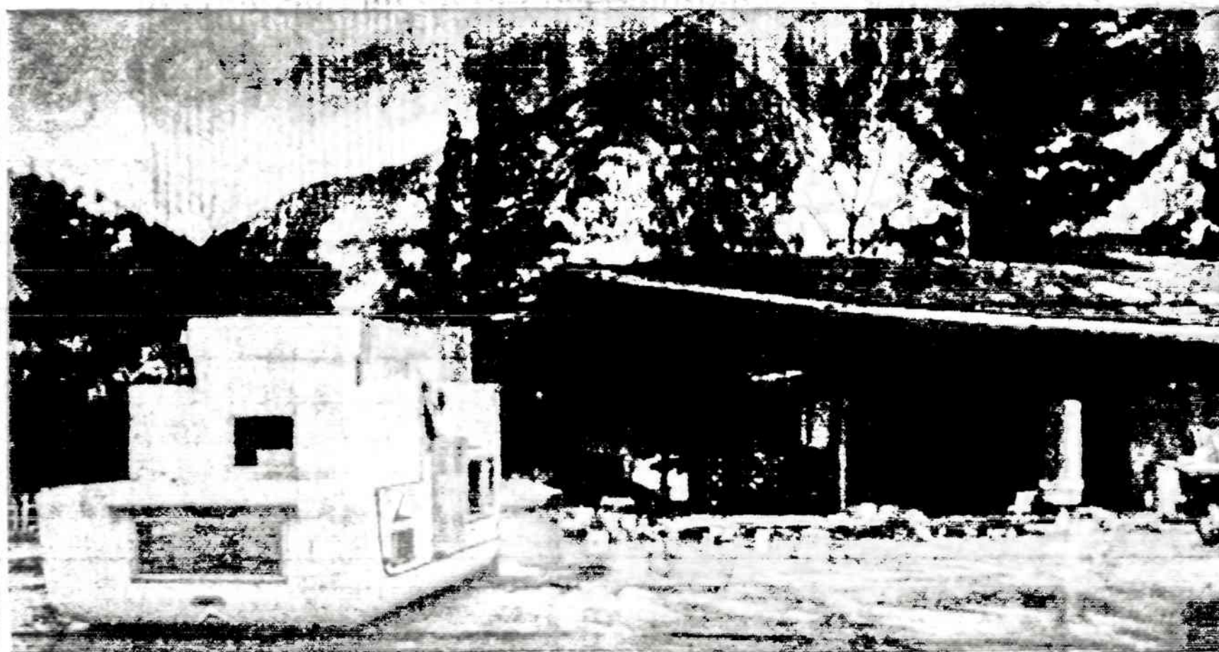
Vienas iš trijų didelių "važiuojamų namų" Lismore treilerių parke, kuriuos nuo 80 iki 100 mylių p. v. greičiu vėjas apverte "auksytinomis". Vaizdelyje galima matyti gražią kalnuotą Britų Kolumbiją — vakarinę Kanados provinciją.

Gerą įspūdį padarė parinktų kalbėtojų temų aktualumas ir programos neapkrėvimas trafaletais. Nebuvo jokio garbės prezidiumo. Man pačiam teko sėdėti pirmoje eilėje su Detroito