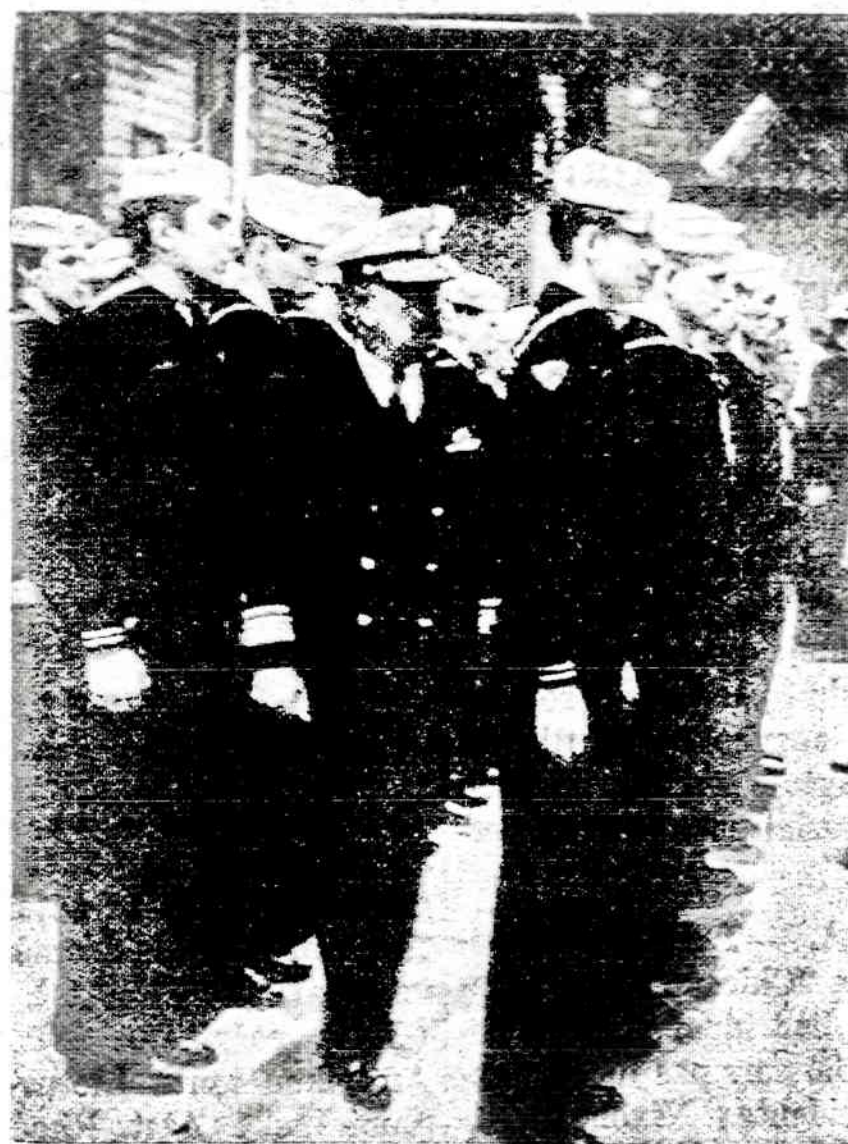
LIETUVIAI PAS AMERIKIEČIŲ JŪREIVIUS

Šio numerio visos nuotraukos yra darytos j. v. s. Leono Knopmillerio. Red.