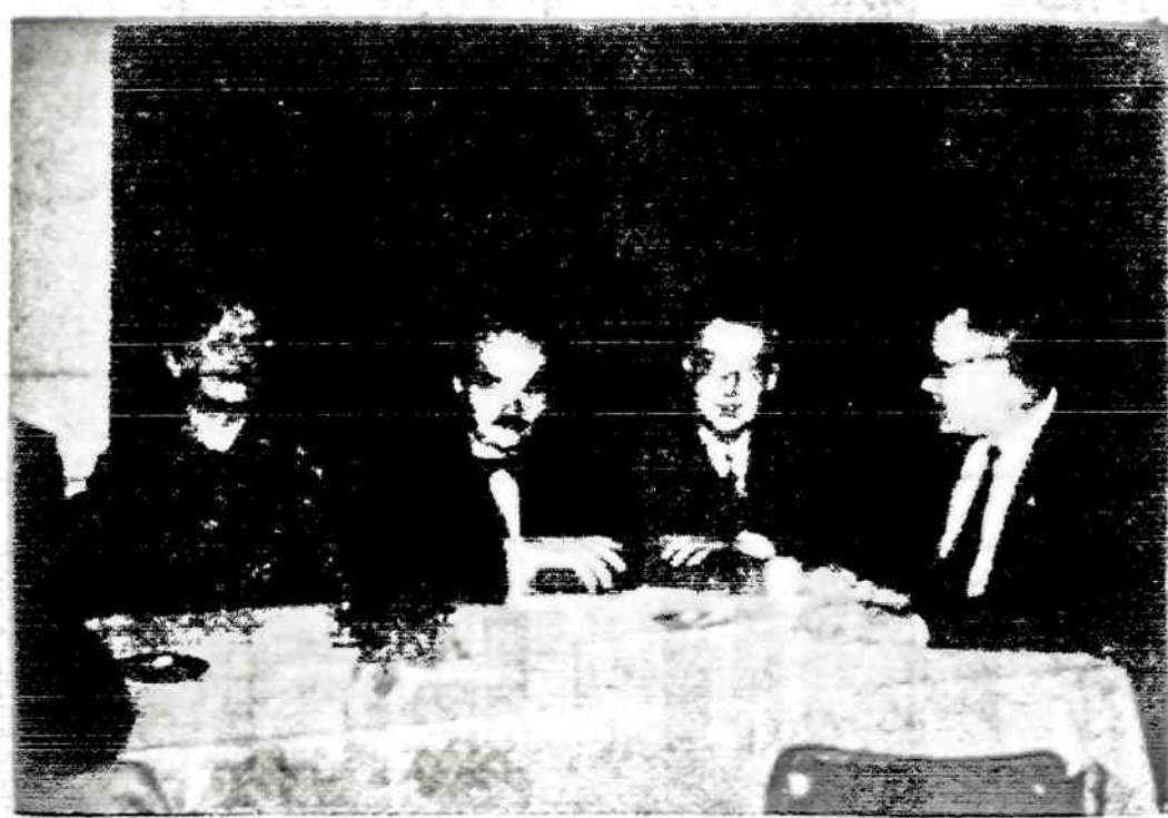
NEPAMIRŠTAMA ISTORINE AKIMIRKA