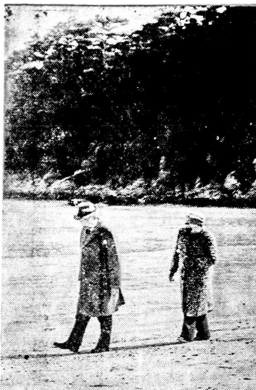
Japonijos vyriausybė padovanojo savo imperatoriui naują pajūrio vilą. Nuotraukoje imperatorius Hirohito ir jo žmona Nagako vaikštinėja jūros pakraščiu. Vila yra 90 mylių nuo Tokijo ir jos vardas "Susako".