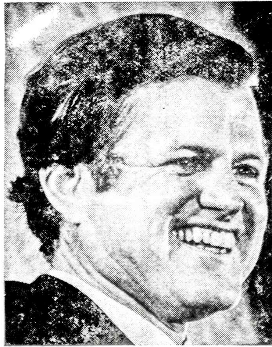
Senatorius Edward Kennedy kelis kart yra griežtai pareiškęs, kad jis nėra kandidatas į prezidento vietą. Kitiems demokratų politikams nesugebant prasimušti į aiškia kandidato poziciją, jo vardas vis iškyla, kaip kandidato, kuris galėtų suvienyti demokratų partiją.

PLYMOUTH. — Žuvusio sen. Robert Kennedy našlė Ethel slidinėdama susilaužė koją.