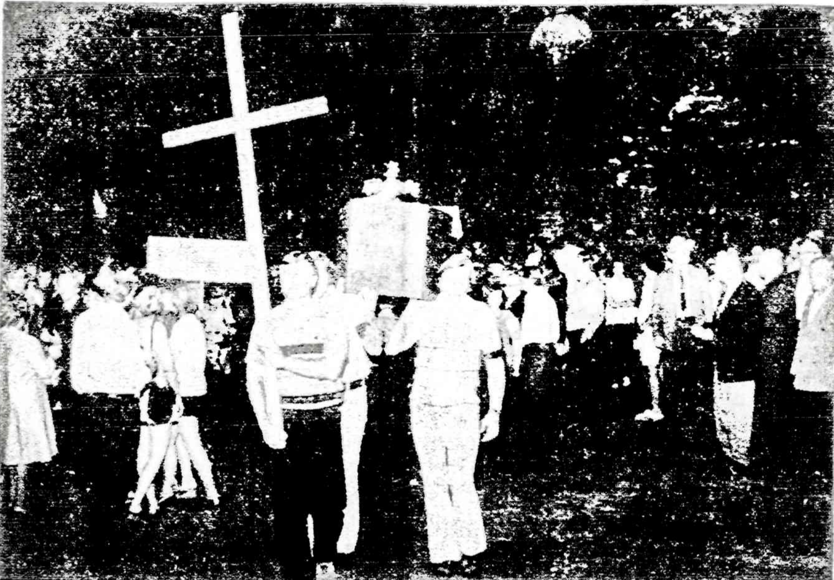
Trečiadienį apie 3,000 eikąs lietuvių susirinko prie Dariaus - Girėno paminklo protesto demonstracijai prieš okupantų elgesį Kaune, kur žiauriausiomis priemonėmis buvo numalšintos jaunu lietuvių demonstracijos. Eikąs demonstracijos dalyvavo daug jaunimo, kuris pradėjo įvyki Marquette Parko gatvėmis su simboliniu Romo Kalantos grabu. Kaip žinoma, Kalanta, 20 metų darbininkas, susidegino, protestuodamas prieš rusų okupaciją, Kauno miesto sode.

Admirolas Zumwalt jau pareiškė nepritariąs tokiai senato analizei.