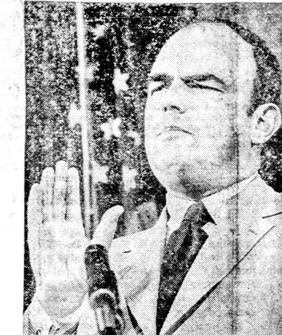
Prezidento patarėjas John Ehrlichman spaudos konferencijoje griežtai paneigia vieno korespondento klausimą: ar bus pakelti pajamų mokesčiai?