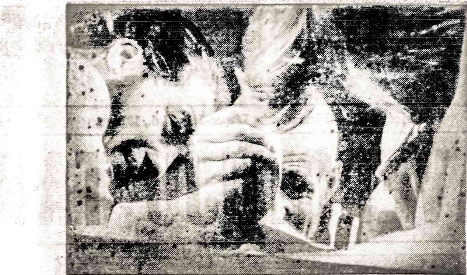
Vaidas iš Petaluma, Kalif., kur nuo 1962 metų vyksta pasaulinės "riešų ristinų" pirmenybės.

Atsiveikinu su visais ir 10 val. vakaro sėdu į BOCF srausminį lėktuvą, kuris skrenda iš Londono į Sidnėjų. Lėktuvas pilnas šeimų su mažais vaikais. Tai daugiausia darbininkų šeimos, o ne tipinga turistų grupė. Pasirodo, jog tos šeimos emigruoja iš Anglijos į Australiją. Anglijoj didėli bedarbė, o australiečiams trūksta darbininkų, todėl žmonės keliauja geresnio rytojaus ieškoti. Kelionė labai ilga ir varginanti. Nebeprisi-