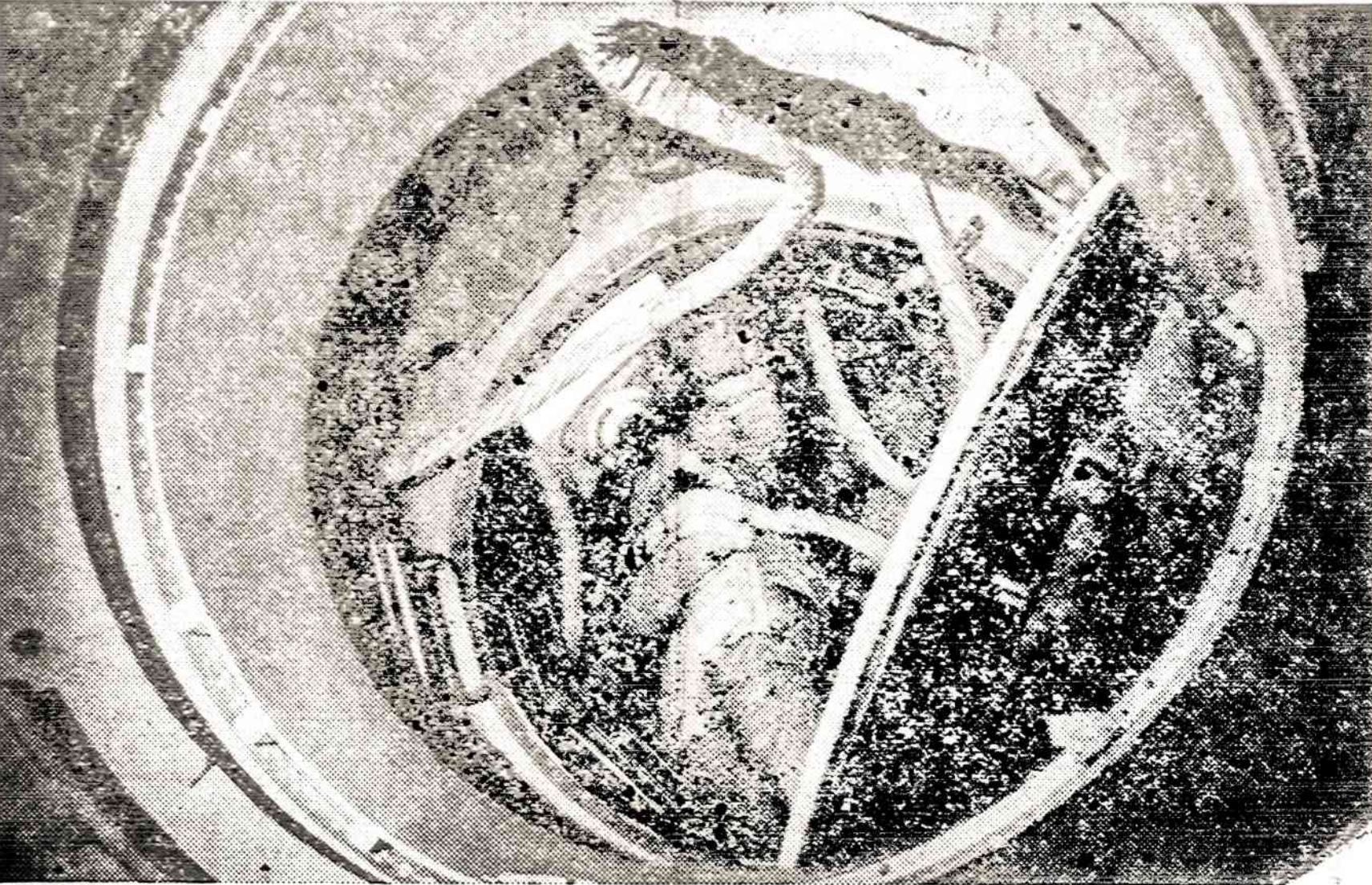
Astronautai ruošiasi kelionėms erdvės laboratorijose, kur jie išbūs virš 50 dienų. Čia matomas erdvelaivio vaizdas iš perėjimo tunelio pusės.

Fischeris sutiksias vėl lošti su Spaskiu dėl titulo, tačiau tam reikės nemažų pinigų. Fischeris noris kurį laiką pasilikti Islandijoje, kur jis bandys žuvalyti ir važiuos apžiūrėti garsaus Surtsey salos ugniakalnio. Jis nesidomys jam organizuojamu pagerbimu New Yorke. „Aš nemėgstu žmonių, kurie man ploja“, paaiškino šachmatų čempionas.