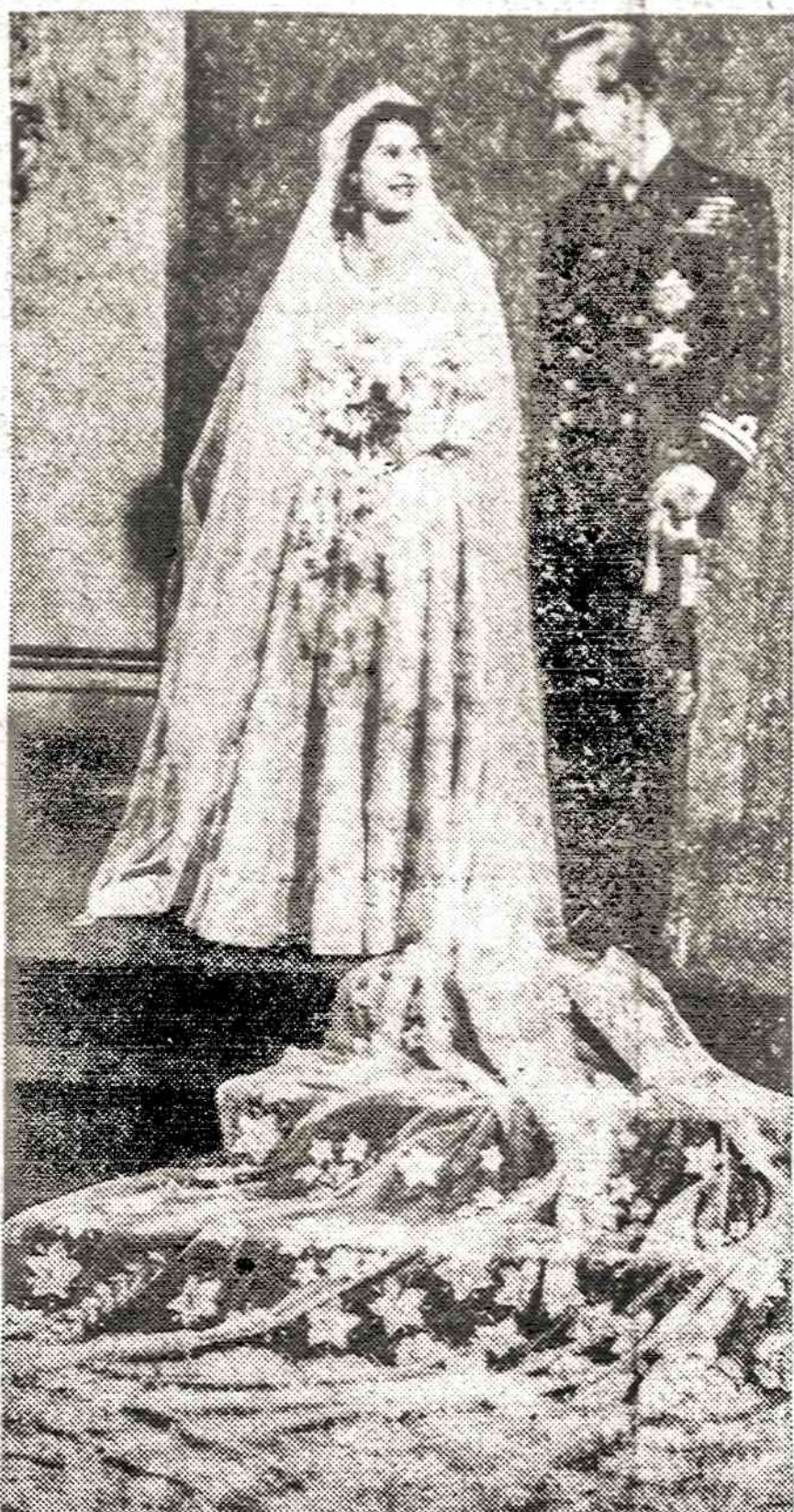
Lapkričio 20 dieną sueina 25 metai nuo britų princesės Elzbietos ir Graikijos princų Pilypo vedybų. Čia matome oficialią tų vedybų nuotrauką.

Naujas įstatymas apims apie 100,000 užsieniečių diplomatų ir JAV vyriausybės "oficialių svečių".