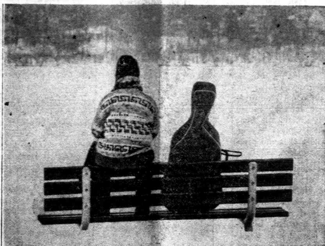
Mergaitė laukia autobuso netoli, Mineapolio, M n. Jai gali tekti ilgai laukti, nes daug sniego ir autobusai vėluoja.

Kovai su girtuokliavimu š. m. vasarą Sovietų Sąjunga išleis įstatymą, o okup. Lietuvos Aukščiausios Tarybos prezidentas įsaką. Šiais nuostatais numatoma prieš girtuokliavimą kovoti visuomeninėmis (komisijų sudarymas įvairiose įstaigo-