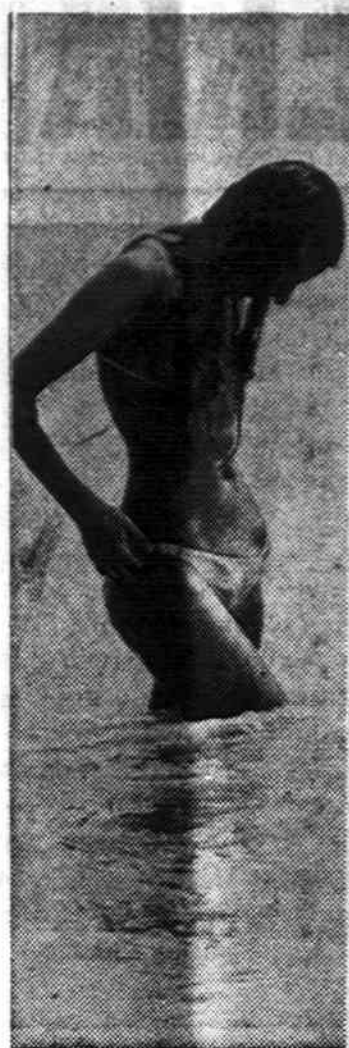
Brazilijoje dabar vasara. Ši gražuolė nufotografuota Ipanema kurorte, prie Rio de Janeiro.