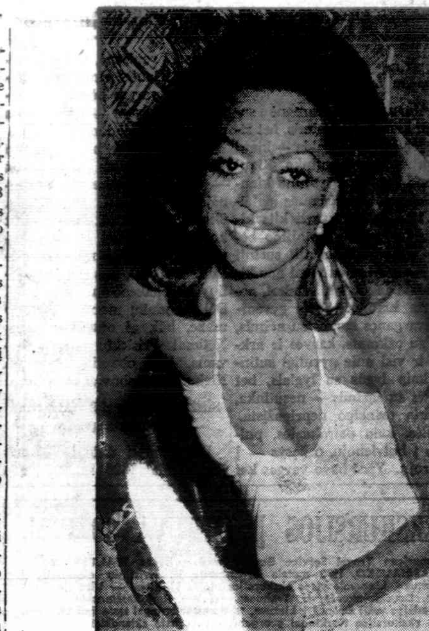
Juoda dainininkė Diana Ross gerai pasirodė savo pirmame filme ir jos atėjus Hollywoodo esanti garantuota.

Kuomet į valdžią atėjo vokiečių socialdemokratų ir atsiskaidė nuo Rytų Vokietijos, tūlas mūsų tautiškų nusiminė ir net pasakė: "Jau ir vokiečiai nebeis į Rytus,