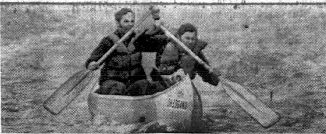
Vairių valčių mėgėjams tenka sužalti ir ge'okai sušlapti Amerikos greitose upėse.

Dar buvo pora tautinių šokių ir pora uždromųjų kalbų, bet aš jų nebemačiau ir nebegirdė- jau. Lituanistinės mokyklos, dvidešimt ketvirtuosius naujų- jų ateivių eros Amerikoje me- tus užbaigiant, vis dėlto, yra nuostabus dalykas.