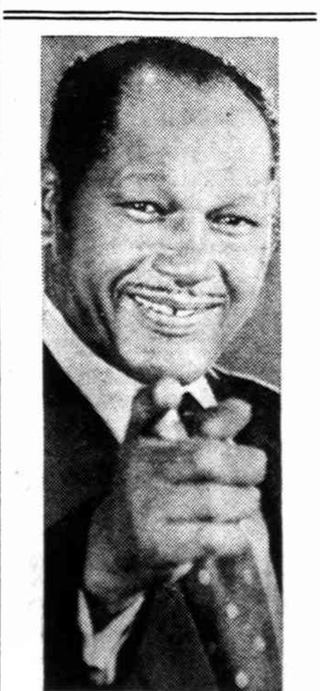
Naujas Los Angeles miesto meras Thomas Bradley kalbasi su korespondentais. Jis pareiškė, kad jo iškirkimas meru yra pilietiško pasisakymas prieš rasizmą.