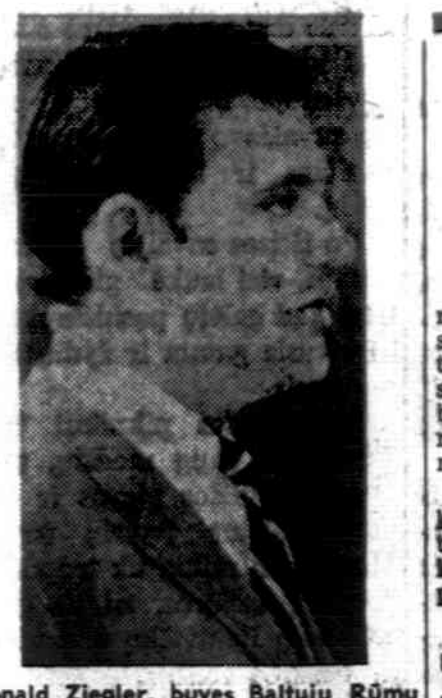
Ronald Ziegler, buvęs Baltųjų Rūmų spaudos sekretorius, dabar paaukštint-tas ir jo pareigos prapleštos. Jis va-dinamas prezidentinio asistentu.

Chicago mieste cikadų nėra nė vienos, kadaigi per gatvių cementą jos negali prasigrauzti, bet užmiestyje žmonės nuo tų vabzdžių cirkpimė ir visur lin-dimo nebeturį ramybės. Buo darže per Naujųjų piktiką bu-