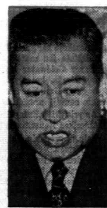
Atlikus valstybės keliaujus Kambodijos buvusį valdovą princą Norodom Sihanouk pareikė, kad jis derėtų su Amerika dėl Kambodijos statuso, tačiau niekad nesidėris su dabartiniu Kambodijos prezidentu Lon Nol, kuris esąs tėvynės išdavikas.