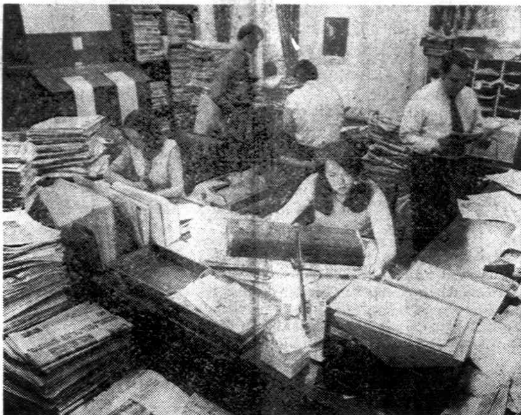
Baltuose Rūmuose yra įstaiga, kurios uždavinys kasdien peržiūrėti 45 dienraščius, stebėti televizijos stotis ir kasdien paruošti apie 30 puslapių žinių santrauką, kurią skaito prezidentas Nixonas. Žinių atrinkėjai dirba šešias dienas savaitėje. Prezidentas žinių santrauką gauna kasdien 8 val. ryto.

Amerikos vyriausybė dar svarsto, ką daryti. Kai kurie stebėtojai nurodo, kad monarchijos panaikinimas įsigalios tik po Graikijos gyventojų referendumo.