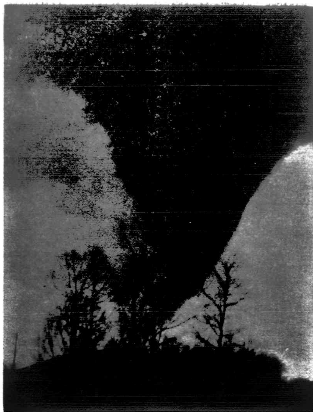
Pavasariui atėjus, prasideda tornadai. Šioji nuotraukoj parodyta, kaip atrodo tornadas.

Tikrumoje tarp naujosios kairės aktyvo ir komunistų, jokio esminio skirtumo nėra. Abeji naudoja tuos pačius metodus ir tą pačią retoriką paverkimui žmonių ir tautų, tik visa tai pritaikant moderniesiems laikams ir demokratinių jėgų politiniams bei socialiniams ėjimams. Komunistai savo ekspansijai pritaikė naująjį iškalbingumą arba semantikos mokslą ir jį naudoja maišydami su retorika, sofiz-