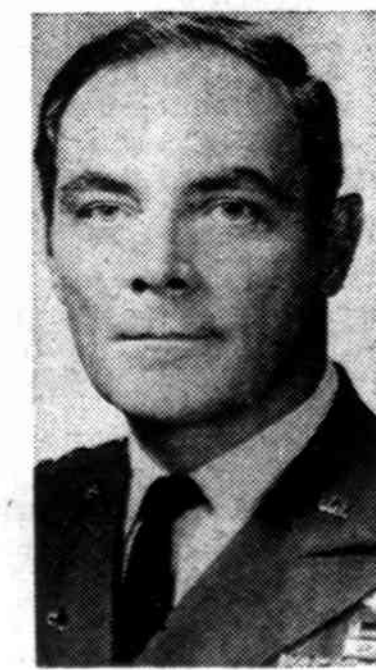
Generolas Alexander Haig nuo rugpjūčio mėn. pasitraukia iš kariuomenės ir lieka Baltųjų Rūmų štabe, buvusioje Helmedano, kuris pasitraukė dėl Watergate skandalo, vietoje.

Opozicijos veikėjai smerkia šitokį referendumą, kuris nieko negali pakeisti, o tik patvirtinti valdžios siūlymus.