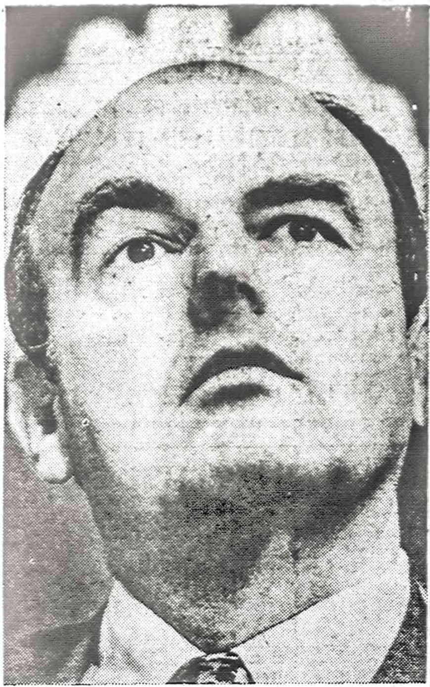
John D. Ehrlichman

John D. Ehrlichman, buvęs vienas vyriausių prezidento patarėjų, atsakinėdamas į Senato Watergate komiteto apklausinėjimus pasirodė kaip labiausiai atsidas prezidento Nixono gynėjas nuo įtarinėjimų.