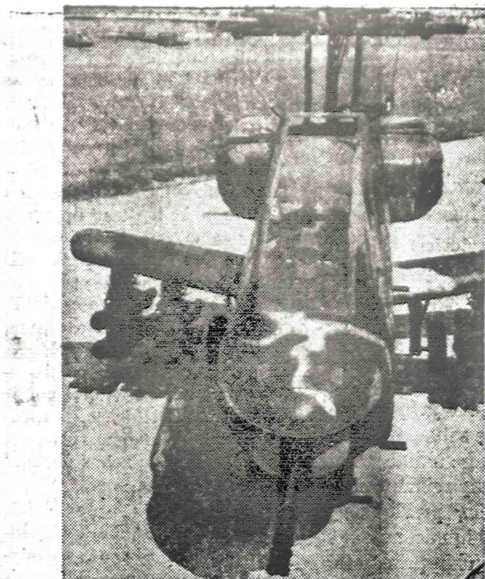
Pavyzdys naujo helikopterio, kokį Textron Bell Helicopter Company pastatė JAV-bių armijai. Šis helikopteris gali sudaryti tankus ir panašius taikinius dienos ar nakties metu nepaisant koks būtų oras.