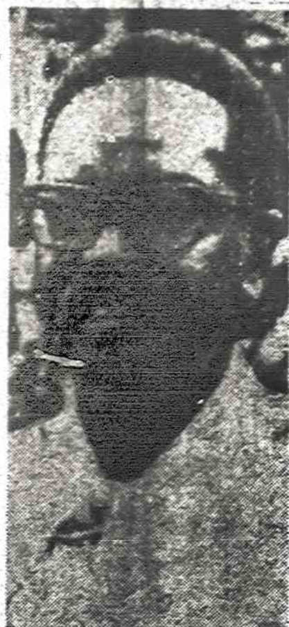
Du didieji Sovietų remiamos populiaros partijos judėjimo išlaisvinti Angolą — premjeras Lopo do Nascimento (kairėje) ir prezidentas Agostino Neto (dešinėje) laimi politikiškai ir kariškai. Pranešama, kad Portugalijoje didėja šalininkų pripažįstančių populiaro fronto Luandos vyriausybę.