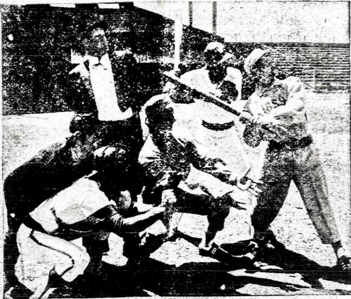
Massachusetts valstijoje, Pittsfield žaidimo lauke susirinko didokas būrys žaidėjų prie žaidimo pradžios taško. Paveikslė matome senų žaidėjų grupę, pasipuokusią senomis skrybėliuotomis uniformomis, ir naujų žaidėjų grupę, viską pritaikytą skubai ir greitai sprendimams.