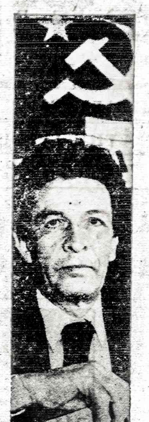
Italijos komunistų partijos pirma-sis sekretorius Enrico Berenguer prieš rinkimus skelbė, kad jis nepri-klausys nuo Maskvos, bet šandien jis jau fotografuojasi kūlo ir plau-tuvų seselyje. Jis išleido stambias Maskvos sumas rinkiminei agitacijai. Jeigu jam bus leista dar viena progą, jis išleis dar stambesnes sumas, kad laimėtų reikalingą daugumą.

Jonynas "Pilenius" Joninės įvyks šeštadienį bir-zelio 26 d. Pradžia 6 val. v. Ren-