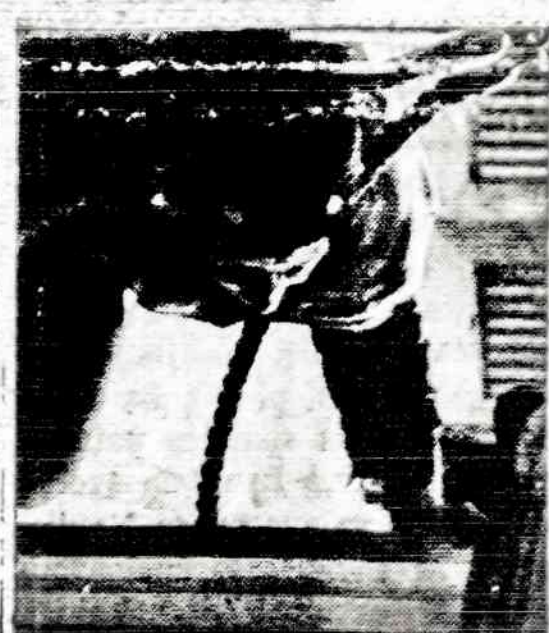
Filadelfijoje, Laisvės salėje dar- bininkas kelia Laisvės Varpą, į savo vietą, kad lankytojai galėtų jį pamat- yti ir prištų palieči. Specialiai įren- gti prietaisai neleidžia lankytojams Varpą pagadinti chemikalais ar ko- kais kitais prietaisais.

Jeį jūs negaunate gerų, šva- riai ir nesunkiai nusilpančių apelsinų, jei jie yra su nepa- gedaujanomis sėklomis ir sun- kia atskiriamomis skiltelėmis, pabandykite apelsinų rūšį - tangerinus.