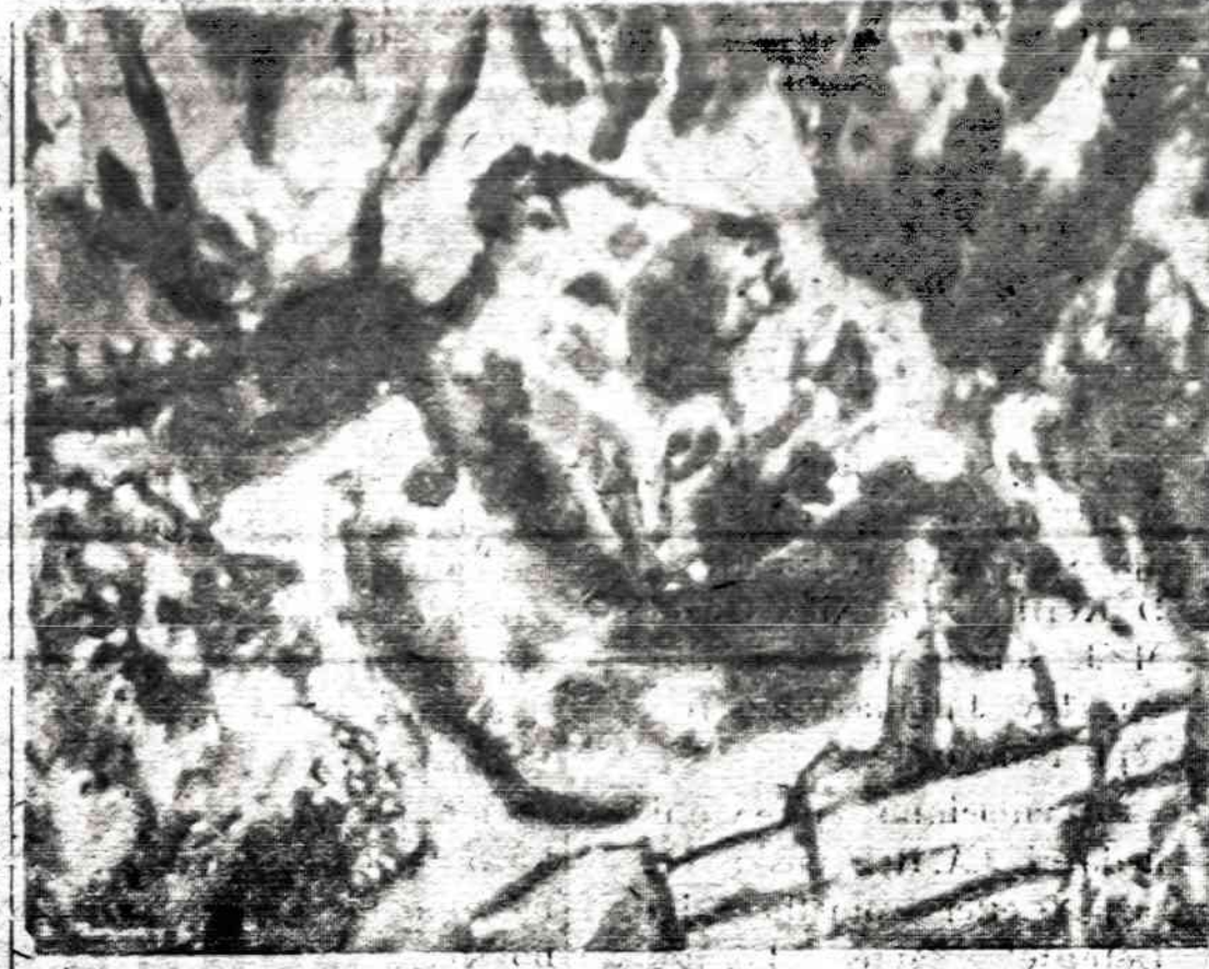
BR. MURINAS Velykų vakaras (akvarelė)

★ Montrealis kviečia stovyklauti ir neskautus. Skautų ir skautiškų stovykla rengiama rugpjūčio 1—15 d.d. "Baltijos" stovyklavietėje. Gali dalyvauti ir