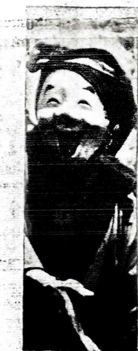
Japonijos šinto šokių šokėja džiūnų patenkintais kareiviais. Ji šoka Tokijo lankoje išvažiavantiems kareiviams. Ji savo drabužius nekeičia, bet yra užsidėjusi vaidintojos maskę.