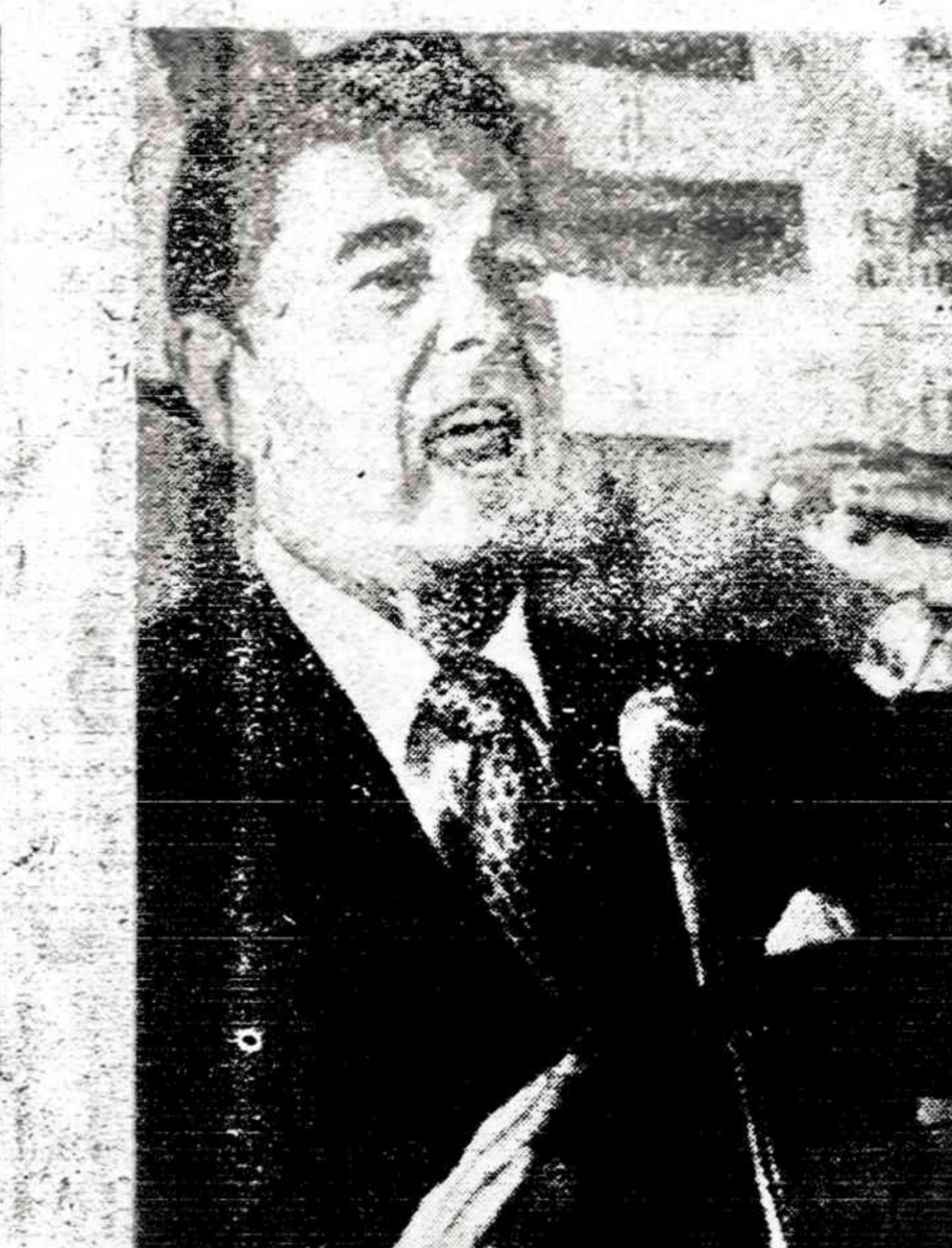
Ronald Reagan, kad ir pralaimėtų, jokiū būdu nesutiktų būti prezidento Fordo administracijos viceprezidentas, Tarp prezidento ir jo yra nepaprastai dideli nuomonių skirtumai įvairiais vidaus ir užsienio politikos klausimais.

TOKIO. — Šiaurės Korėja perspėja, kad dialogas su Pietų Korėja baigia galutinai sustoti, kadangi Pietų Korėja ruošiasi karui ir "siekia nukariauti komunistus". Iš savo pusės šiaurės Korėja kursto Pietų Korėjos gyventojus nuversti prezidento Park Čunso Hee