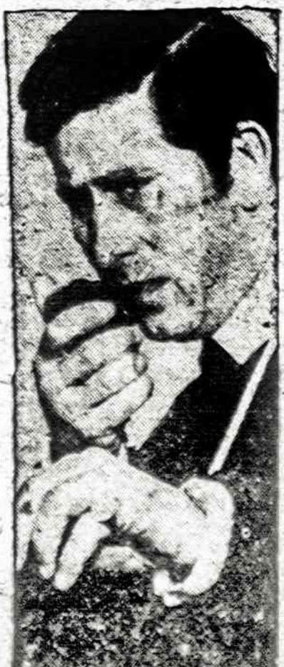
Anglijos princas, Charles, sulaukęs 25 metų amžiaus, ryžosi imti atsakomybę krašto administracijos darbuose. Jis nori gerai susipažinti su valstybės pastangomis padėti jauniems vyrams ir moterims atsistoti ant savo, nuo kitų nepriklausomų kojų ir pradėti savarakišką gyvenimą.

NEW DELHI. — Opozicijos kandidatai jau garsiai skelbia, kad pergalė ateinančiuose rinkimuose įgalins iškelti bylą prieš ministrę pirmininkę Indirą Gandhį už jos įvestą "išimties stovį" ir visus per tą laiką išleistus antidemokratiškus įstatymus.