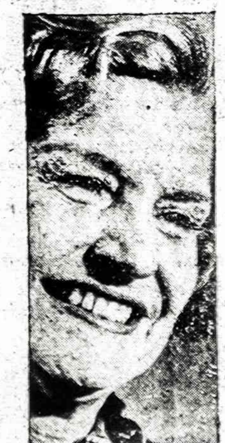
Betty Ford, buvusio prezidento Fordo žmona, pareiškė, kad prezidentui Carteriui nereikėjo nagrinėti "nuodėmėje gyvenančių" žmonių sąžines. Sąžinė yra kiekvieno žmogaus reikalas. Prezidentas privalėtų daryti įstatymus. Jeigu veikiančiai negerti, tai turėtų paruošti tokius, kurie baustų už padarytus nusikaltimus.

Mažiausiai benzino suvartoja 1977 m. automobilis markės Honda Civic CVCC, kuris vienu benzino galionu nuvažiuoja greičiu 52 mylias ir miesto keliais — 40.