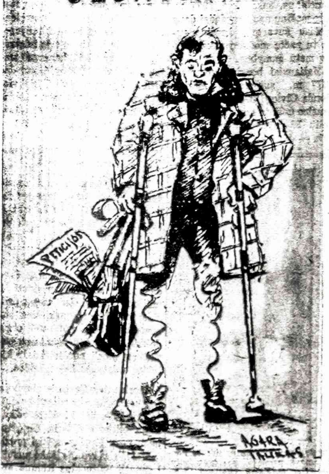
Lietuvių žurnalistu stajaus pirmininko pavaduotojas Butėnas tvirtino, kad šitas vyras žiops lazdomis prispyrą vieną nevą jėzuitą prie čiuromio galerijos sienos. Kaip jis, nelisvirdamas, galėjo toki žydarbi žmiki? Kiekviena palvojančio lietuvio uždaviny — išaiškinti, kaip jis galėjo tai padaryti.