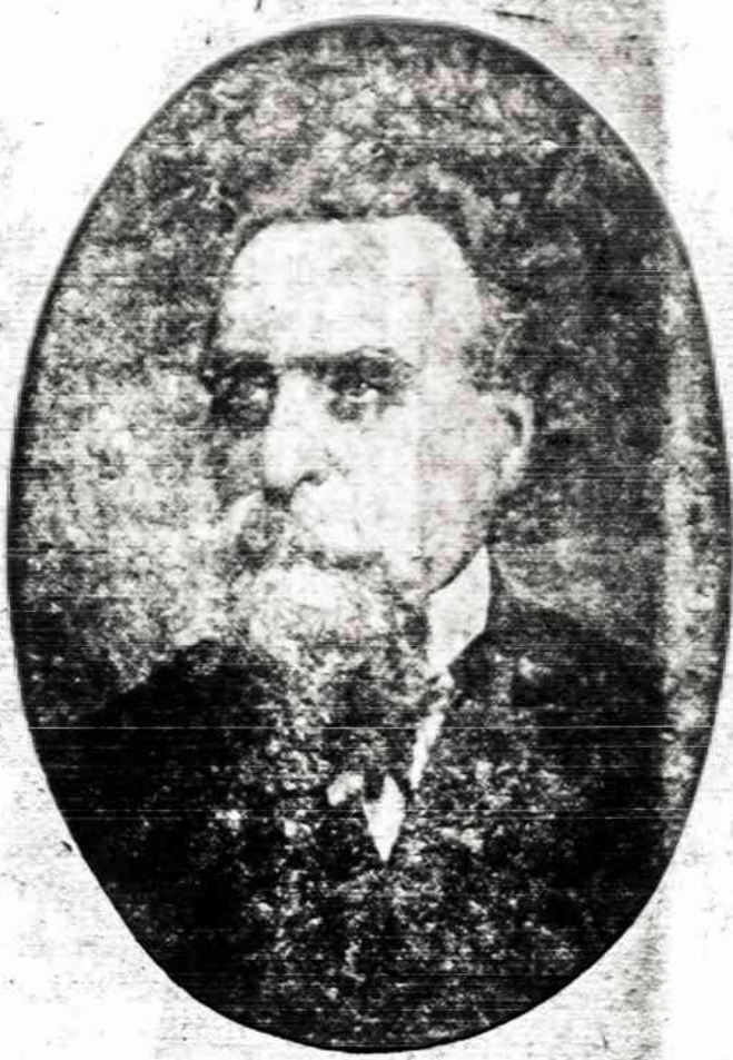
Daktaras Jonas Basanavičius

NAUJIENŲ raštinė atidara kasdien, išskyrus sekmadienius, nuo 9 val. ryto iki 5 val. vakaro. Seštadieniais — iki 12 val.