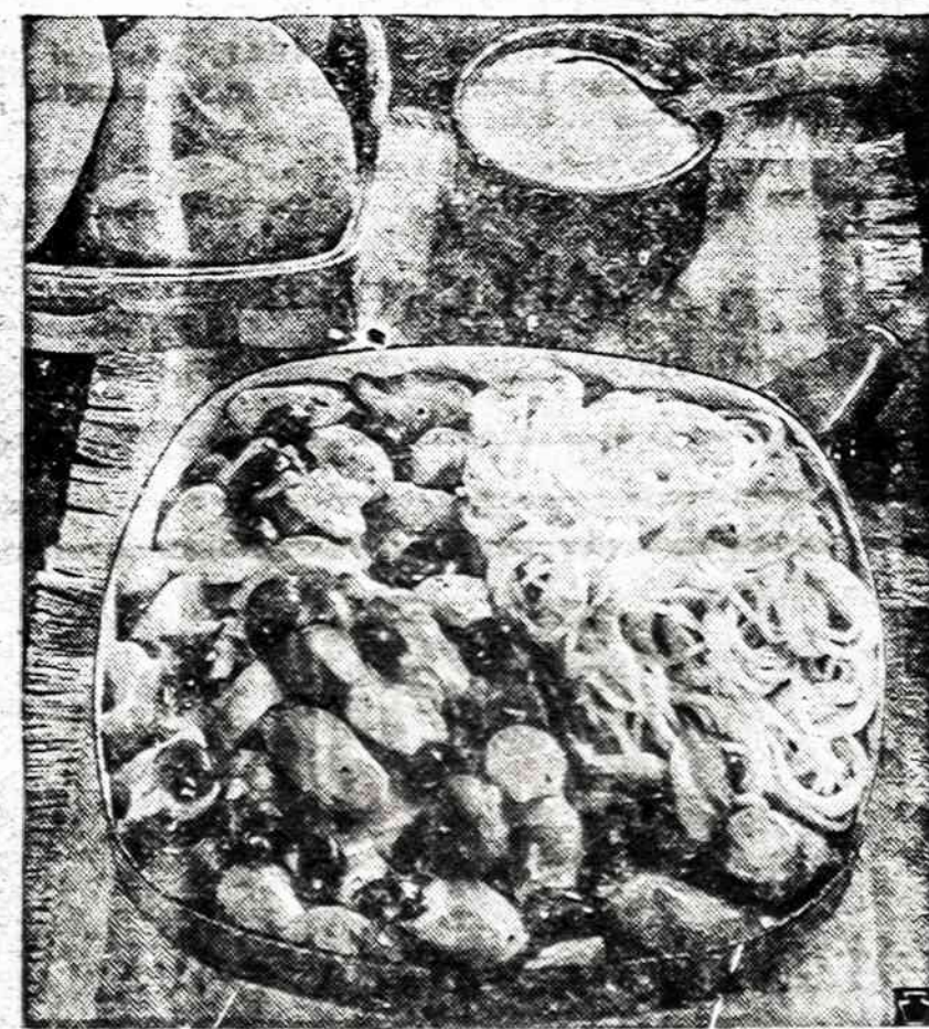
The all-American frankfurter adapts easily and tastefully to this economical, sure-to-please family dinner. Olive-Frank- furter Skillet Supper is an excellent choice for a low-cost, all- in-one dinner dish, because it costs only about 50¢ per serving for a family of five.

liška redaktorių laikysena ne- patarnauja objektyviai tiesai iš- aiškėti, o priešingai, tai kelias skleisti netiesai. K. Str.