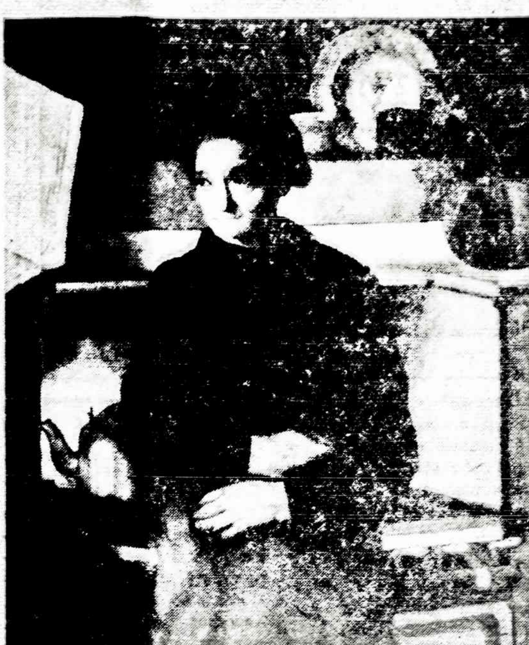
M. SILEIKIS Seimininkė (Tapyba) (Citrulnio Galerijos, Inc. nuosavybė)

Šioj išvykoj dalyvavę pens- ninkai yra dėkingi Pensininkų sąjungos vadovėlei, tipas gal inž. K. Karazijai, už tokios malonios ekskursijos į Cantigny suorga- nizavimą. Dalyvis