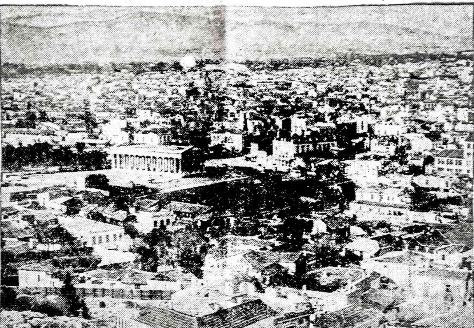
Atėniečiai patenkinti sugrįžusia demokratija į Graikiją, bet jie vis dėlto yra susirūpinę santykiais su turkais. Iki šio mėto graikams nepavyko susitarti su turkais dėl Kiretos, o dabar juos skiria pažiūros į jūros dugno nuosavybę Graikijos salų pakraščiuose. Turakai nustatė, kad toje vietoje yra didkas degalų sioksnis. Paveiktas rodo kasdieninį Aėnų vaizdą.

Pareigūnų pareiškimu, pasiūlymai dėl konkretaus veikimo bus pateikti JT Generalinei Asamblėjai rugsėjo mėnesį.