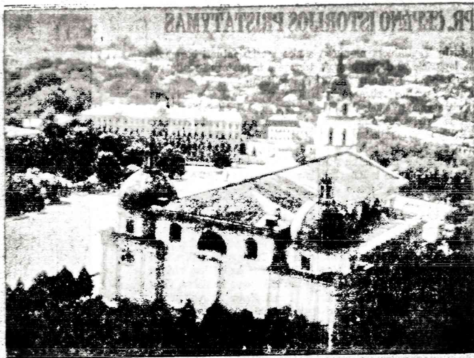
Vilniaus panorama iš Gedimino kalno žiūrint