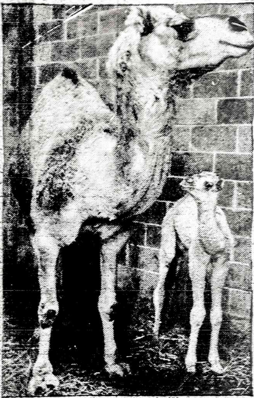
Kupranugarė motina stovi greta gražiai augančios dukters. Praeita pavasarį zoologijos soduose gimė daug galvių, kurie per vasarą gerokai pasaugo ir pasruošė surikti žiemos šaltius.