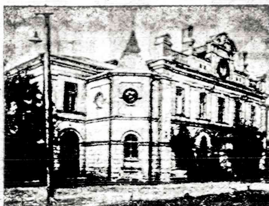
Kauno miesto teatro rūmai

7:00 ir baigsis 9:30 val. vakaro. Vyresniųjų klasiėje bus dosto-ma keramika įvairiais moty-vais: vazos, indai, figūrėlės, ba-rajefai ir t. t. Parinktieji dar-biniai bus išdegami kietoje me-džiagoje.