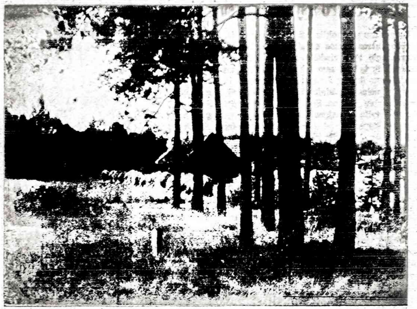
Lietuvio ūkis gražiai klestėjo ir daug prisidėjo prie ekonominio klestėjimo

Televizijos geroji pusė Nėra abejonės, televizija yra labai vertingas žmogaus išradimas. Radijas jau pasidarė kaip