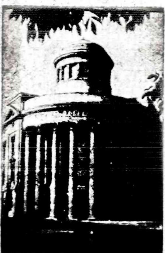
Kauno igulos bažnyčia.