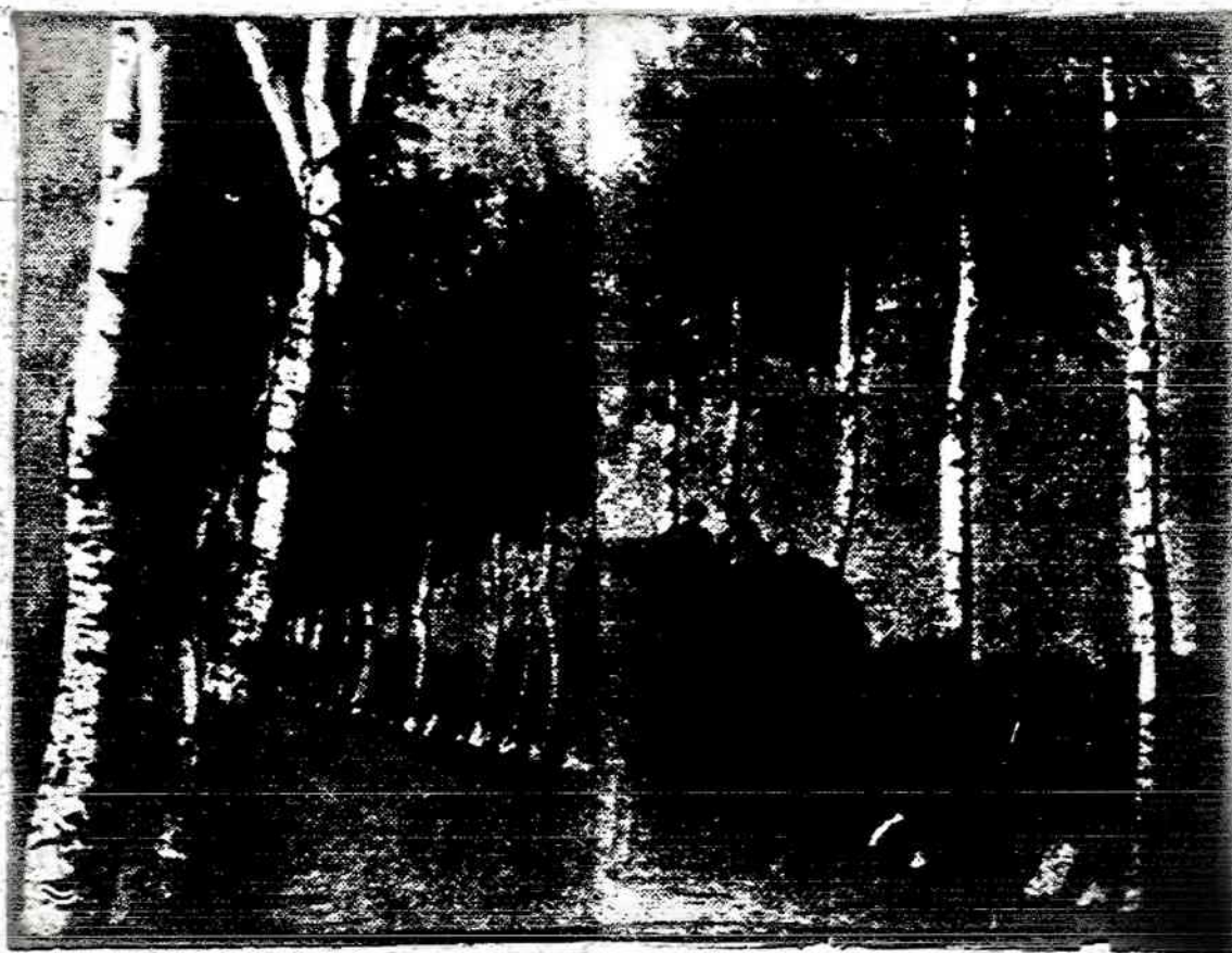
Beržais nusodinto kelio rudens vaizdas