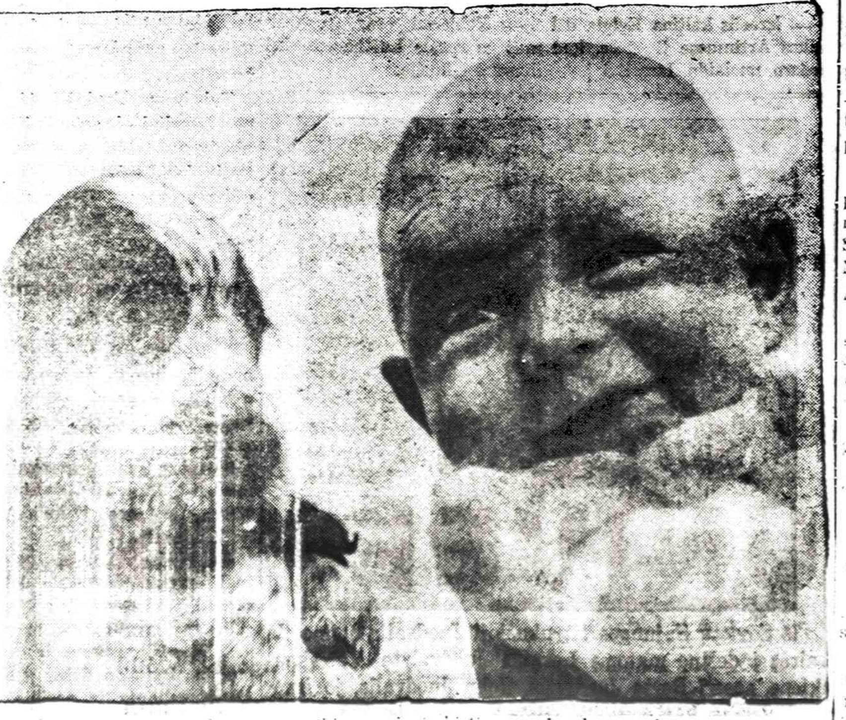
... nespekta, nors priklauso vieni iš tų, kurie bendruomenėms.