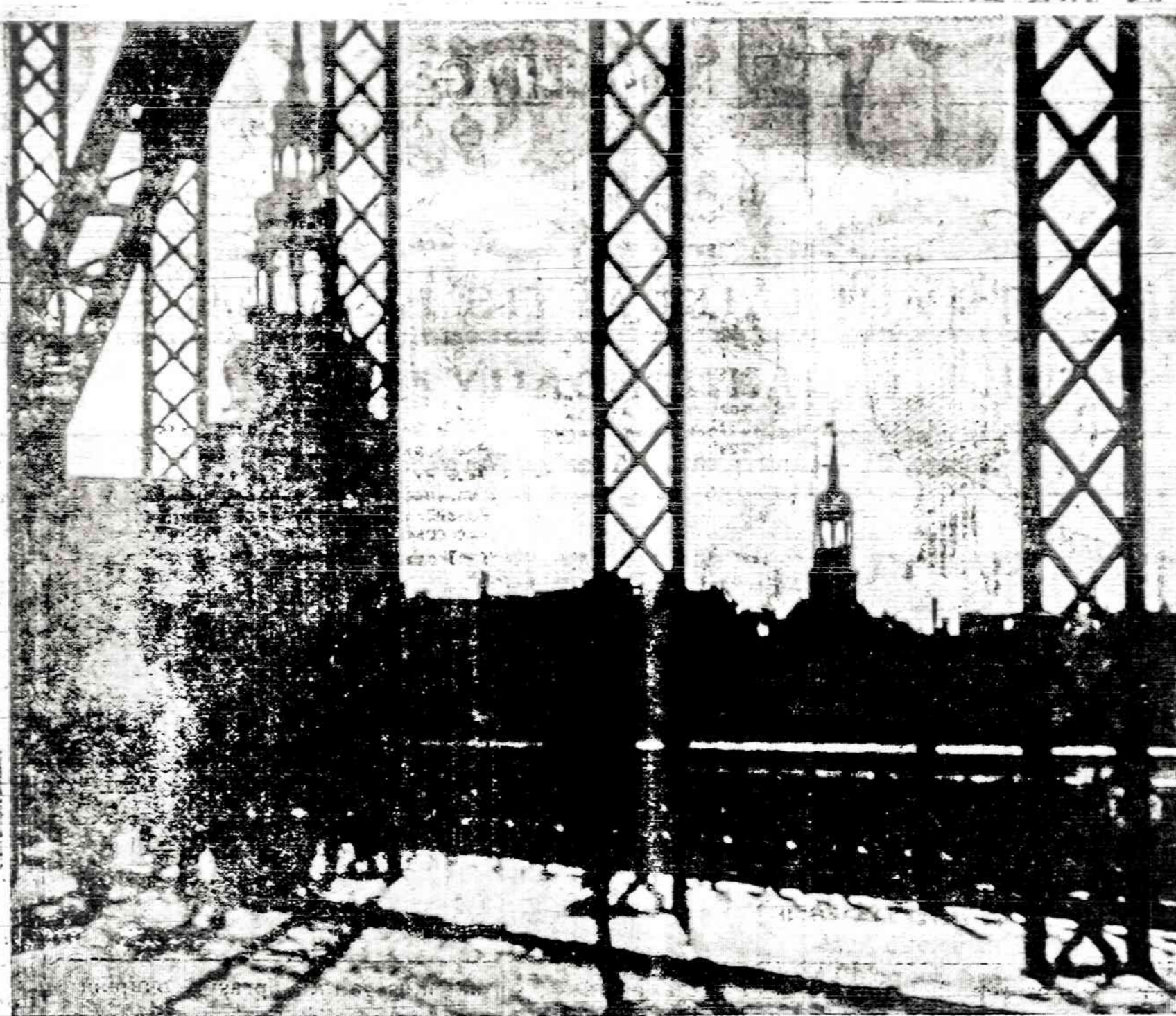
Reizės vaizdas iš Panemunės žiūrint

Daug lengviau užsilaikyti turint pakalotą kraujospūdį pagal gydytojo nurodymus, turint žmogų, kuris turėtų būti mažesnis, saugintis būti tikrai žmogumi, apsiginti be pavojus, keistis kitam biologiui troškime. Dar čia prilaikyti žmogus, reikalingas prisivalginti, reikalingas gyventi, reikalingas būti patenkintam ir gerbiamam. Normiam žmogui visai nereikia pakalotą kraujospūdį.