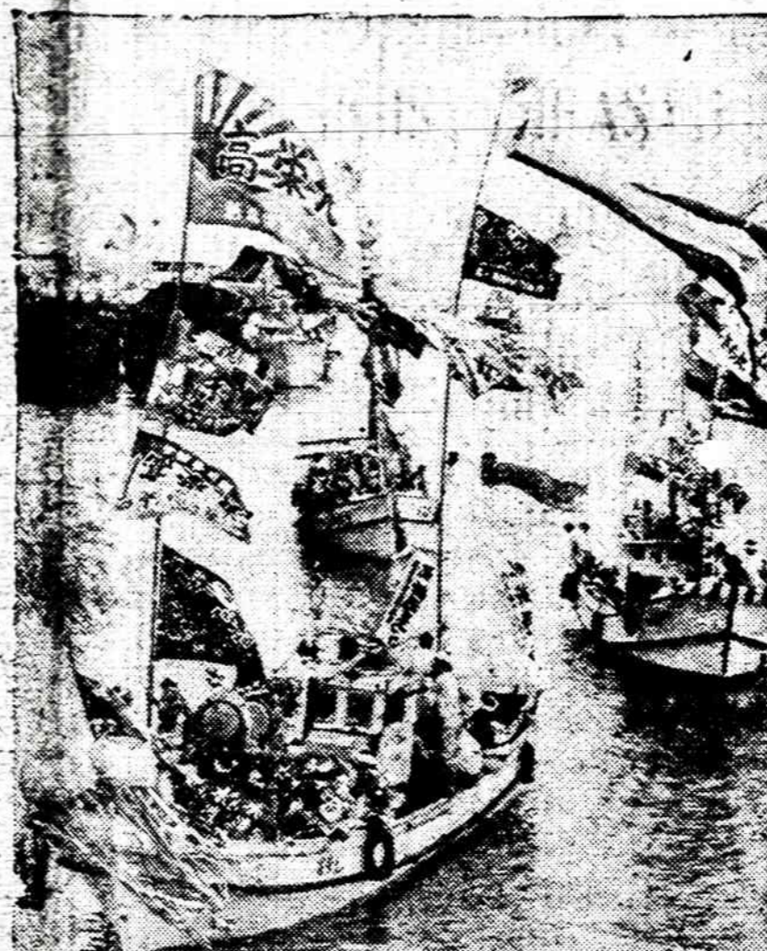
Iškilmingai papuošę savo laivus, Japonijos žvejai plaukia Sinano upe festivalio metu.

Weizmanas taip pat nori išaiškinti, kiek Egiptas jms iš Izraelio turistų mokesčių už ekskursijas į Sinajaus kalną. Šitie du klausimai, atrodo, Izraeliui labai svarbūs.