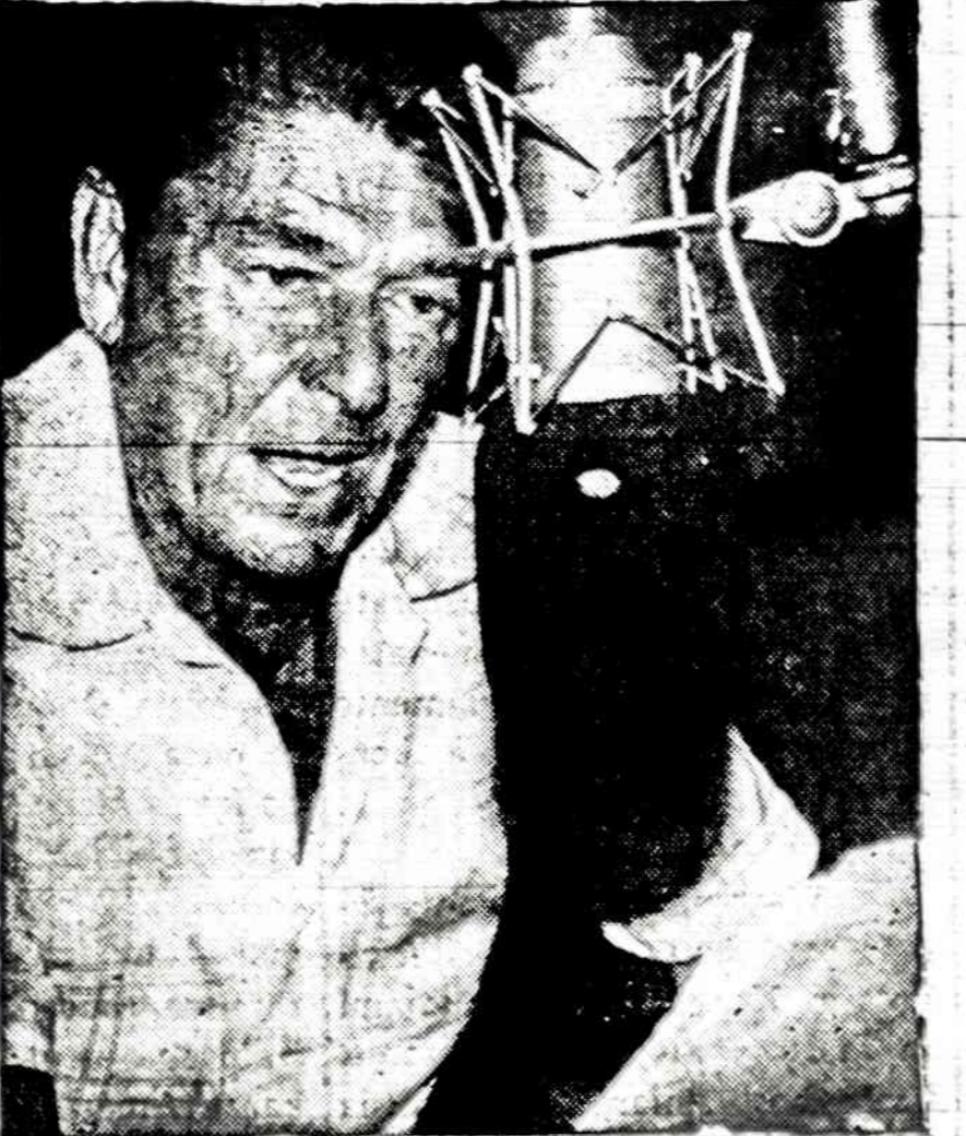
Buvęs Kalifornijos gubernatorius Ronald Reagan nori tapti respublikonų kandidatu prezidento pareigoms.

Ambasados kambariuose buvusieji dokumentai išdaryti ir išmėtyti, atidarinti visos spintos ir stalčiai. Pradžioje manyta, kad ten rasta keli slapsti dokumentai, bet ambasados reikalų vedėjas pareiškė, kad ambasadoje nebuvo jokių slapstų dokumentų. Į JAV ambasadą kartą jau buvo įsibrovę Chomeinio šalininkai, bet vėliau kariai privertė juos sumažinti toną prieš amerikiečius. Reikalų vedėjas reikalauja išspręsti studentus iš Amerikos ambasados.