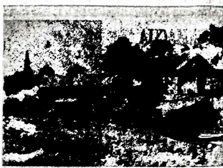
Matome Jonušo "Sniega mėnesienoje"