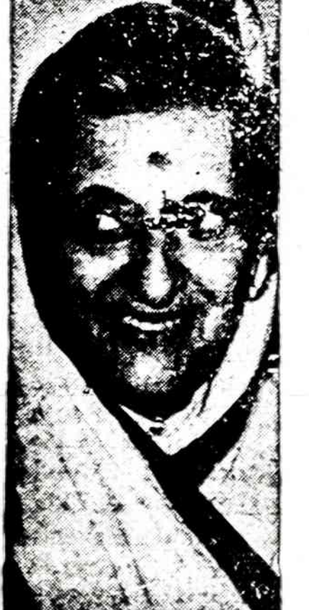
Indira Gandhi, naujai išrinkta Indijos premjerė, patarė rusams galimai greičiau išsikraustyti iš Afganistano.