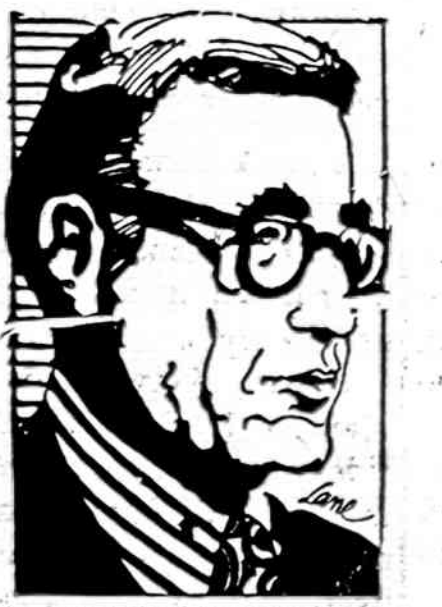
HAROLD BROWN Secretary of Defense

Jeigu Sovietų kariai bandys grobti bet kurį naftos versmų centrus Persijos įlankoje, tai rusai privalo žinoti, kad kilis karas, — Clifford paaiškino Indijos premjeriui.