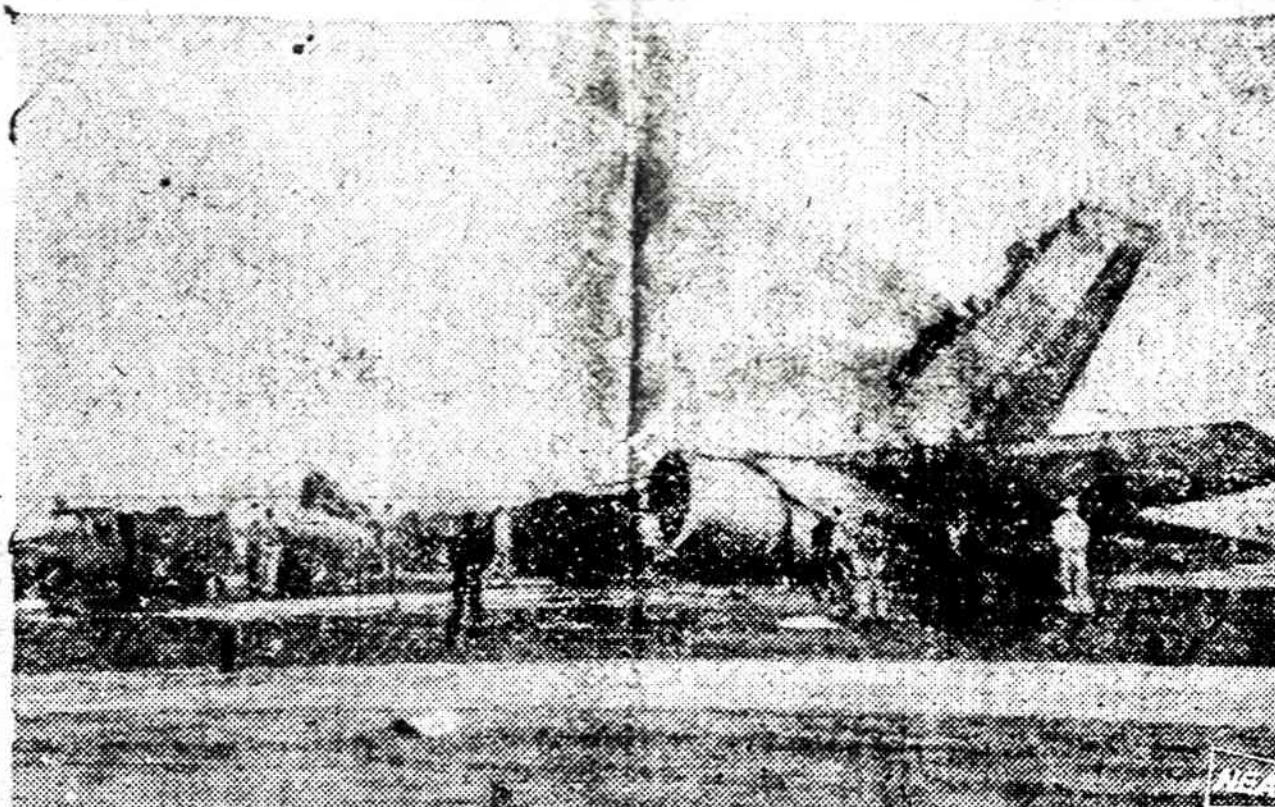
Savo laiku palestiniečiai Kaire išsprogino sprausminį 747 lėktuvą, o dabar reikalauja, kad Sovietų Sąjunga atšauktų savo divizijas iš Afganistano.

Naujai išrinktas Irano prezidentas reikalauja, kad visos ginkluotos pajėgos klausytų tik tai jo įsakymų. Jeigu neklaustys, tai jis atsistatydinsias.