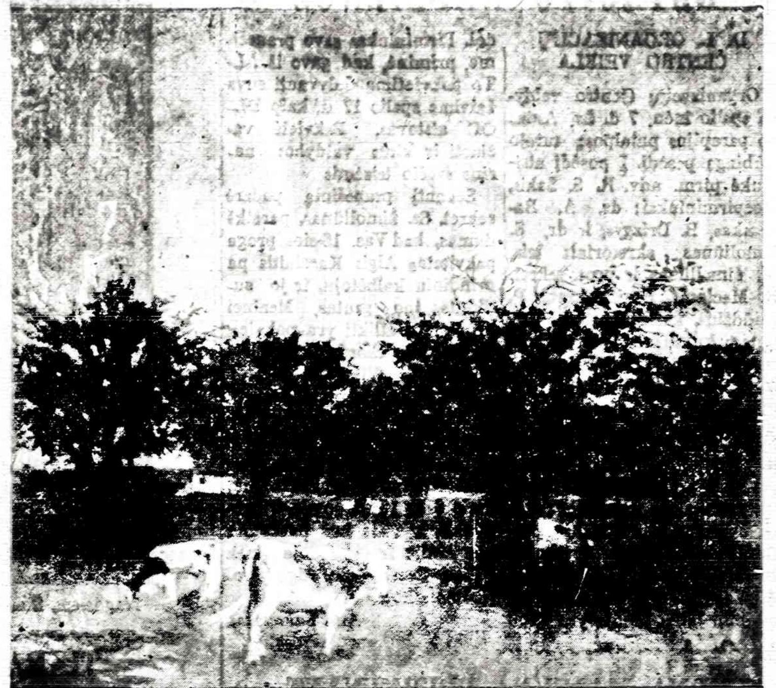
M. SILEIKIS Karvės sode (Dabar šioj vietoj O'Hara Aeroportas)

Solidarumo istoriniai nutarimai nebūtų galėję pa-