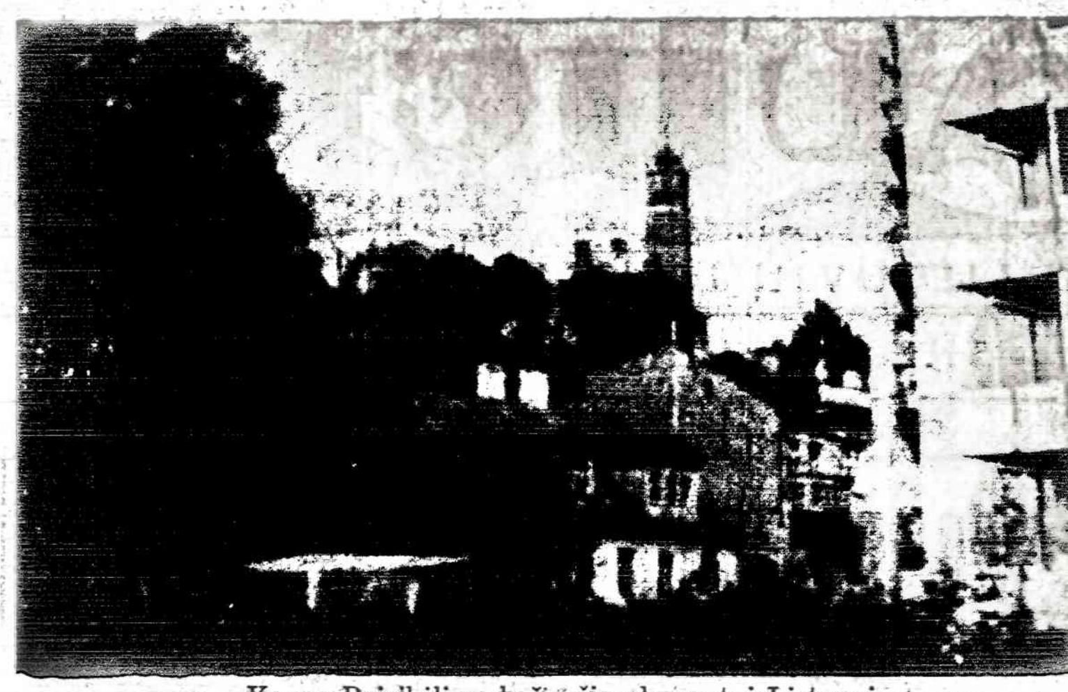
Kauno Priskėlimo bažnyčia okupuotoj Lietuvoj

V-bos 1931. XII. 5 d. posėdyje, protokole Nr. 4 nesužymėti visi posėdyje dalyvavę nariai, kad galima būtų nustatyti ar ir daugiau kas virš minėtų 4 neteisėtai dalyvavo tame baudžiamajame posėdyje. (Žiūr. St. 191 str.)