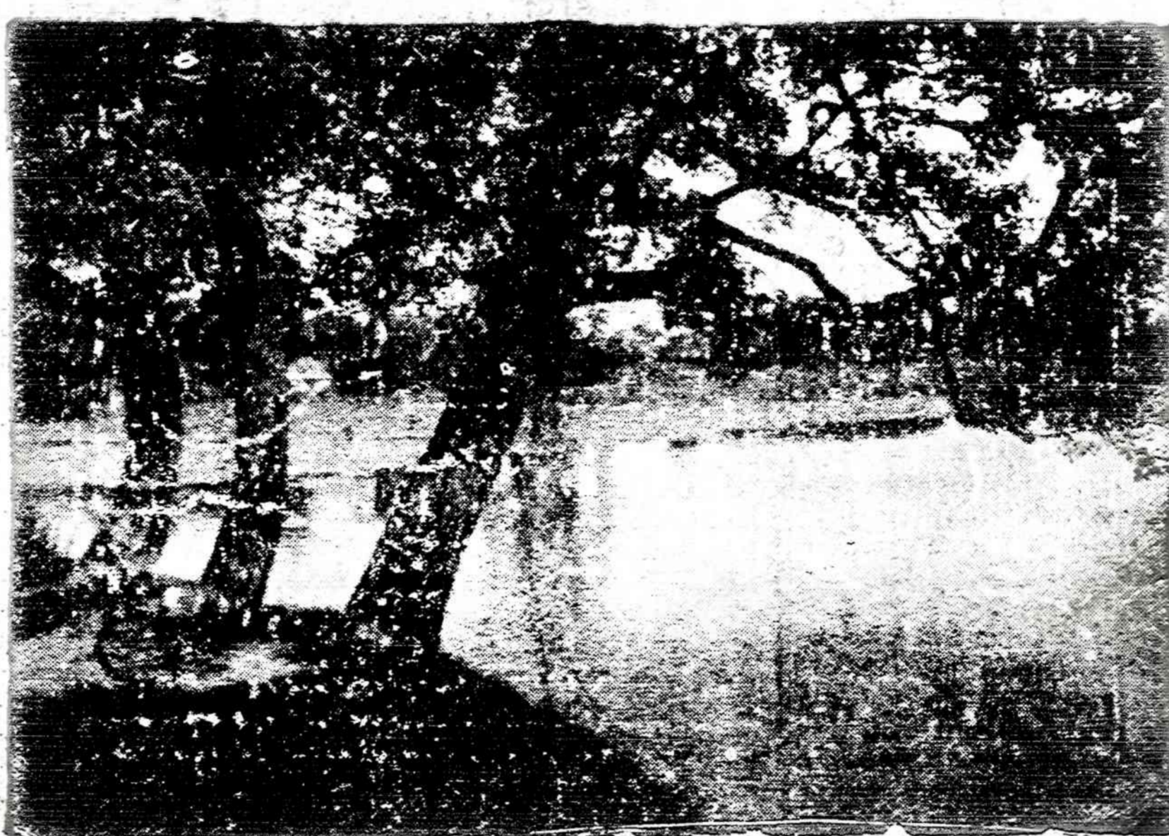
Platių ežero pakraštys

Amerikos Lietuvių Tarybos 45-asis metinis suvažiavimas šaukiamas 1985 m. lapkričio 2 d. Lietuvių Tautiniuose Namuose, 6422 So. Kedzie Ave., Čikagoje. Suvažiavimo registracija prasideda 8.30 val. Suvažiavimo atidarymas 9.30 val. Po valdybos ir atstovų iš Vašingtono pranešimų ir po dalyvių pasisakymų bei skyrių pranešimų įvyks naujos Amer. Liet. Tarybos valdybos sudarymas. ALT pasėdyje