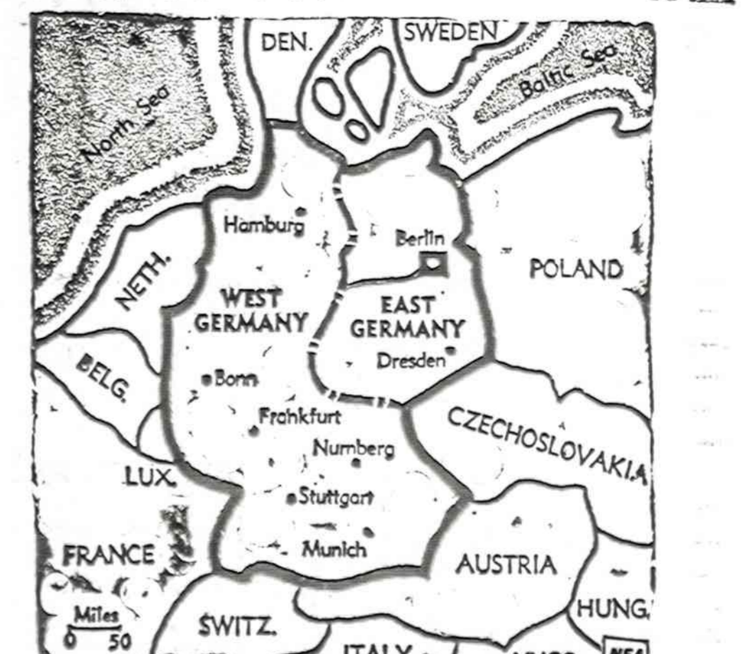
Rusai siųsdami vokiečius iš Rytų Europos, pasiuntė daugybę šnipų, kurie įsibrovė į įvairias demokratines Vokietijos įstaiigas.