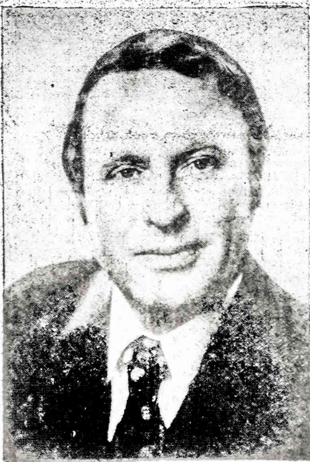
Sen. Alan Dixon pasiūlė pašalinti visus sovietų piliečius iš Amerikos ambasados Washingtono. Kiekvienas jų pranešinėja sovietų kagebistams, kas buvo daroma JAV ambasadoje. Reikia manyti, kad atstovų rūmai pri- tars Dixono pasiūlymū.