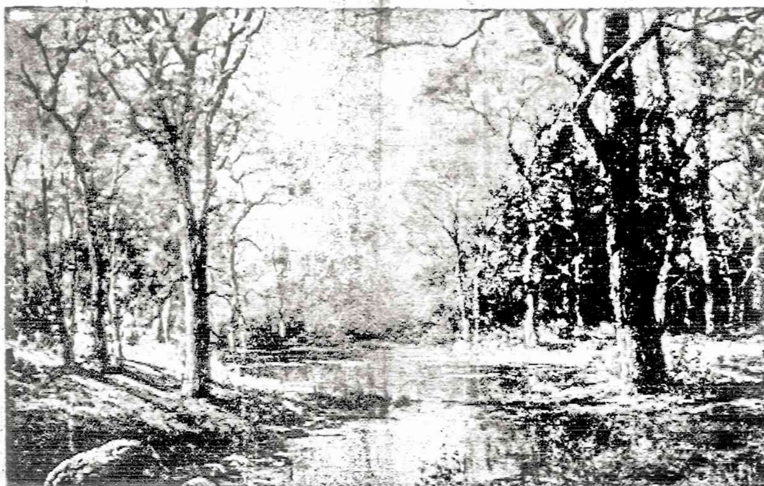
Vietomis lapai jau visi nukrito ir iškrito pinmas sniegas šiaurės Amerikoje.

Rugsėjo 6 d. JAV Valstybės Departamento surtuostame pasiūlytame kalbėjime su privačių organizacijų (NGO) atstovais, ambasadoriumi Walter J. Stoessel, Jr., kuris vadovaus JAV delegacijai Budapešto konferencijoje, pranešė, jog vengrų pareigūnai užtikrino, kad Budapešto konferencija busianti pravesta panašiai kaip ankstesnioji Madride. Pirmąjį ir paskutinį konferencijos savaitę posėdžiai busiantys atviri publikai. Vengrai pažadėjo panašiai kaip Madride akredituoti spaudos atstovus (nors Stoessel apie tai padūrė: "Palauksim ir pamatysim"). Stoessel pabrėžė, kad Budapešto konferencijoje bus išsiaiškinti diskutuojami žmogaus teisių klausimai. Kultūrinis Forumas Budapešte bus pirmas Helsinkio sutarties konferencija už geležinės uždangos ir pirmoji simpoziumas pasvesta Baigiamojo Akto kultūriniais punktais. Amerikiečių delegacijoje dalyvaus dramaturgas Edward Al-