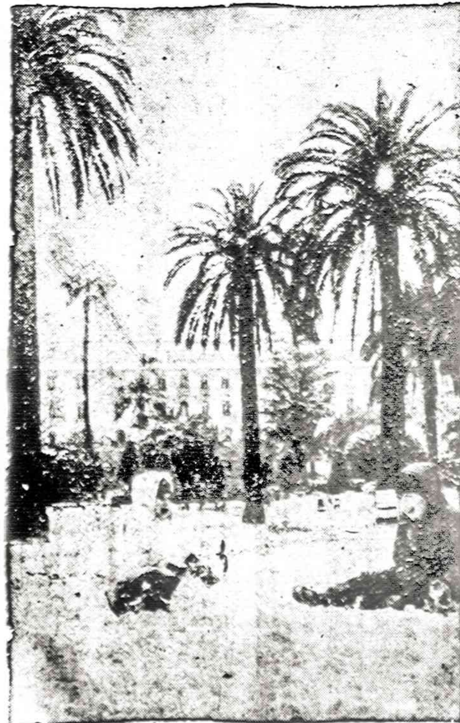
Pirmas sniegas Kalifornijoje