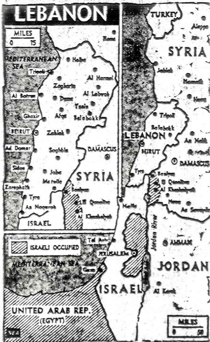
Libano prezidentas Genajel vėl skris į Damaską, kad galėtų tartis su Sirijos prezidentu nuolatinei taikai Beirute.

Gen. Canale pareiškė, kad kaltinamajį aktą skaitys antraeilu, kada bus kaltinami kiti karo vadai. Iš viso yra 16. Jiems prokuratūra reikalau mažesnių bausmių.