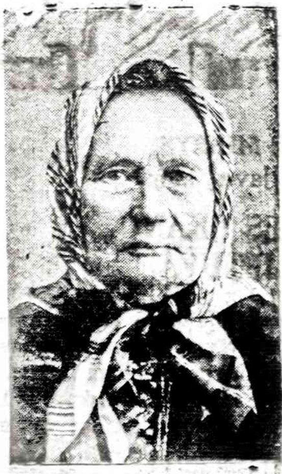
ZEMAITĖ (1890 m.)

Prabrėšk, aušrelė, tekėk, saulele, Spindėk, aušros žvaigždele! Papūsk, vėjel, varyk migelę, Pabudink vieverėlį! Telaukia žmonės dangaus malonės. Galo baisios koronės. Išvysim šviesą, pažinsim tiesą, Sulauksim gero česo. Pabugs tamsybės ir neteisybės Tikros šviesos galybė. Išaus dienele, spindės saulele, Džiaugsis kožna širdelė. Išgaš piktybės ir nedorybės, Atgis mokslas teisybės. Būsim kaip buvę, mes nepražuė. Pragaištin nepakliuė. Gerai gyvensim, amžius pratėsim, Lietuvinkais pasensim. Kožnam vienam meilingi. Būsim doringi ir pakajingi, Pamesim blūdus, nedorus būdus, Naikinsim piktus grūdus. Augsim dorybė, tikroj teisybė, Amžių baigsim linksmybė. Pražus girtybės, paleistovybės, Barniai, provog, vagystės. Žaliuos medeliai, čiulbės paukšteliai, Žaliuos mūsų vaikeliai, Žaliuos pievelės, žydės kvietkelės, Žydės mūsų mergelės.