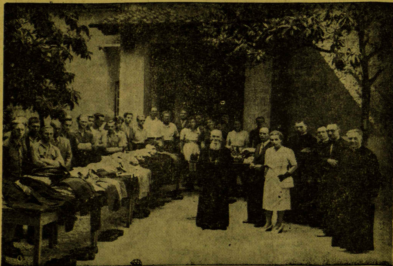
A group of Lithuanian refugees in Rome with members of the Lithuanian Relief Committee in Italy awaiting distribution of clothing sent by the United Lithuanian Relief Fund, a member agency of the National War Fund. Pictured in the foreground is Bishop P. Bucys.