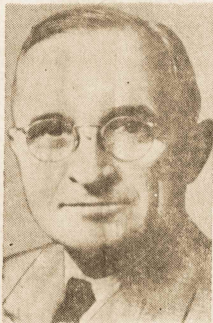
HARRY S. TRUMAN

Lapkričio mėn. 2 d. JAV rinkimai atnešė visišką laimėjimą demokratų partijai — prezidentūroje, kongrese, atstovų rūmuose ir gubernatūrose.