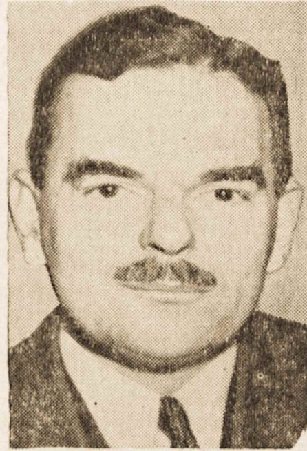
THOMAS E. DEWEY

Demokratai — 229, Respublikonai — 205, Amer. Darbo Partija — 1.