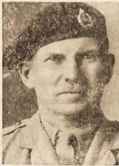
Gen. Maj. F. F. Worthington, iš Vancouver, kuris Krašto Apsaugos ministro Brooke Claxton buvo pakviestas organizuoti Kanados civilinę apsaugą.

Jei sovietai nori atominės bombos uždraudimo, jie privalo ne vien žodžiais užtikrinti pasaulį, bet ir veiksmais: veiksmais, kurie yra garsesni už žodžius: paleisti satelitus ir pasitraukti į savo kraštą, kuris ir taip apima šeštą dalį žemės rutulio.