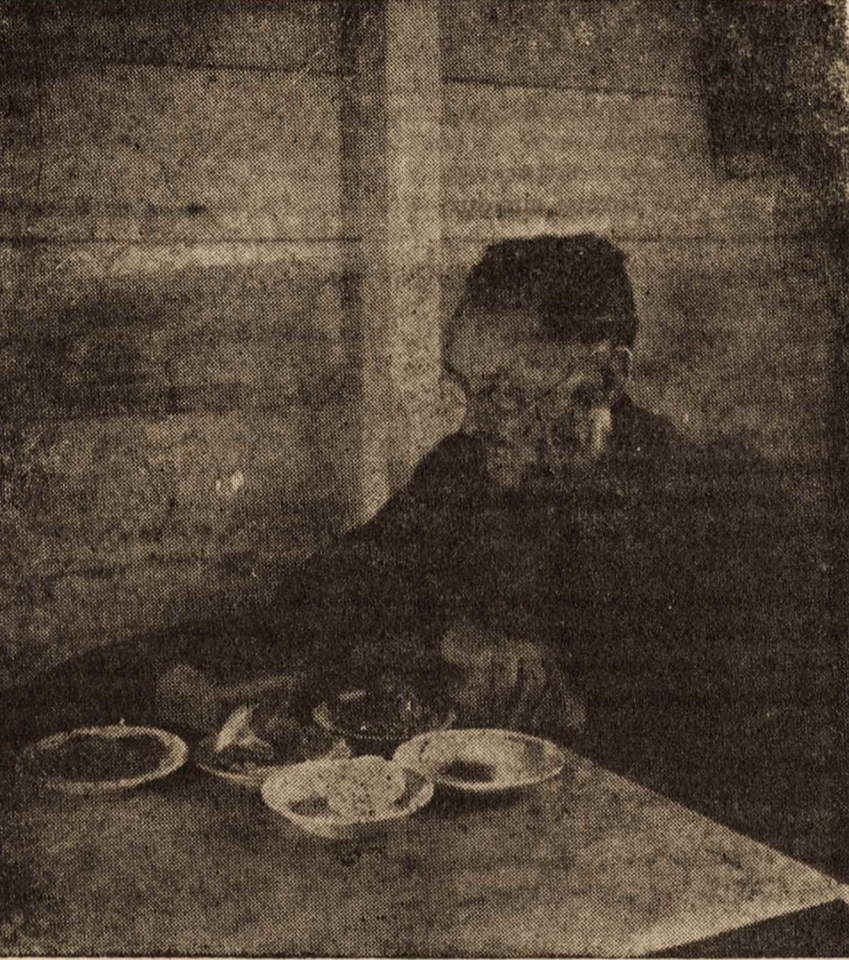
Tremtinys, gavęs Kalėdoms ir visai jų savaitei maistą, žiūri, kaip galės prisimaitinti? BALFAS todėl ragina visus tautiečius aukoti tremtinių naudai.